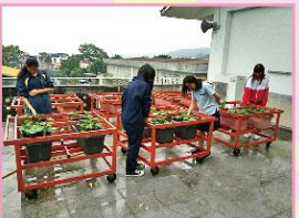
星中教育農園-樂活農園種菜趣