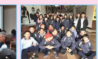
生命教育之電影欣賞活動