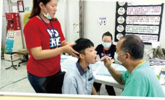
全校學生口腔檢查