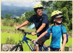
往前騎的同時，不忘看顧後頭的夥伴