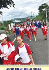
虎字碑成學禮活動