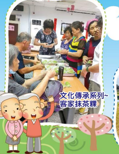
文化傳承系列-客家抹茶粿