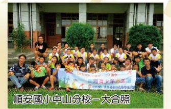
順安國小中山分校一大合照

、積木風車製作、風帆船競賽、積木槍射準、積木投石器等。看著小朋友們從一開始的瑟縮到最後的欲罷不能，志工們覺得即使再累都值得。