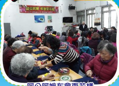
阿公阿嬤布會耍花樣