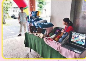
107學年度身心障礙課後照顧平日班成果展