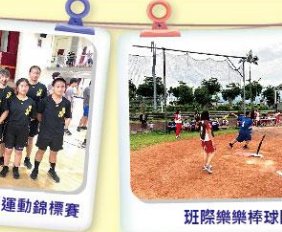
宜蘭縣中小學拔河運動錦標賽