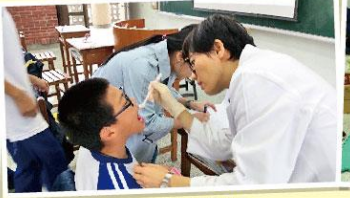
長庚醫院口腔檢查及衛教