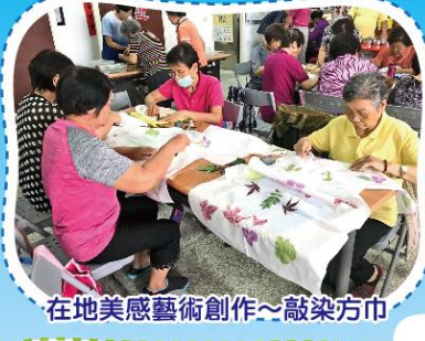
在地美感藝術創作~敲染方巾