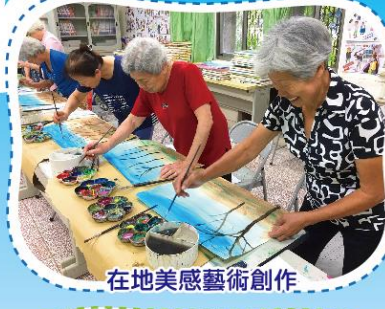
在地美感藝術創作