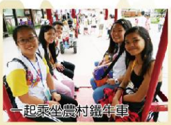
一起乘坐農村鐵牛車

安農溪為三星在地的明顯地標，為了讓學生更了解在地文化，這門課即由老師帶領學生悠騎單車，探索安農溪沿途的人文風情。從安農溪上游開始，進入蘭陽水力發電廠，除觀察安農溪沿途風光外，並了解微型水力發電模組之運作。此外，還有天送埤懷舊車站、落羽松秘境探訪、九寮溪生態之旅等，讓學生一步步認識自己的家鄉，並產生家鄉認同感及自我價值感。往前騎的同時，不忘看顧後頭的夥伴