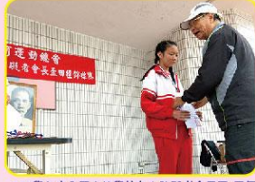
107學年度全國中等學校身心障礙者會長孟-田徑