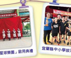
風雨操場「星球樂園」啟用典禮