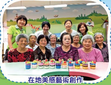
在地美感藝術創作