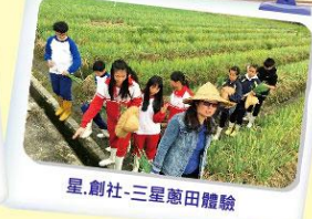
星、副社-三星蔥田體驗