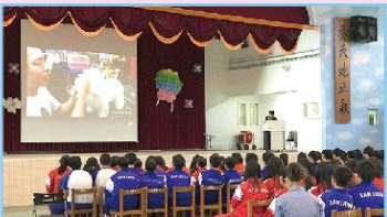
九年級-職業達人分享-寵物美容