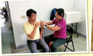
教職員工流感注射