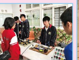
八年級-高職參訪-羅工