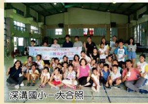
深溝國小一大合照

由全世界張氏宗親會補助成立的三星製造-國際志工偏鄉服務團於今年暑假成立，希望學生不僅能學到知識，還能將這些所學宅配到偏鄉學校，使偏鄉學生也能享受到科學及科技教育。在培訓了數次後，今年暑假國際志工團共前進到4所國小進行服務，包括：頭城鎮大溪國小、冬山鄉順安國小中山分校、蘇澳鎮蓬萊國小、員山鄉深溝國小，活動內容包含：動手做自己的機器人