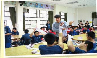
運動傷害防護包裝