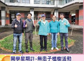
開學期計-無患子植樹活動