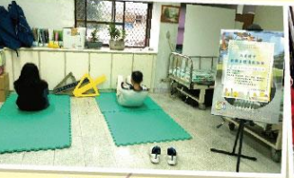
教職員工體適能檢測