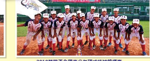
2018蘭陽盃全國青少年硬式棒球錦標賽