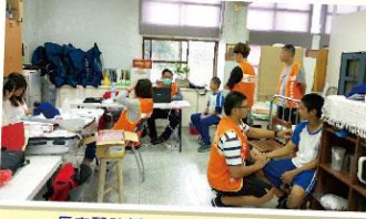
長庚醫院偏鄉巡迴醫療