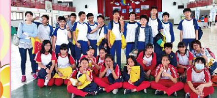
宜蘭縣防災避難+CPR競賽