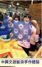
中興文創藍染手作體驗