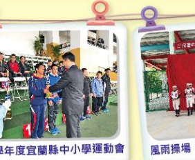
107學年度宜蘭縣中小學運動會