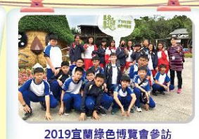
2019宜蘭綠色博覽會參訪