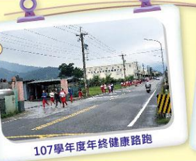
107學年度年終健康路跑