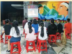
一同欣賞原民電影

本校學生有1/3為原住民，且多為泰雅族。本校此次申請到一梯次獵人學校課程，讓學生在三天兩夜的族群活動中學習到更多關於傳統的技藝與文化。學生不僅學習族語對話和部落禮儀、觀賞原民電影、佈陷阱、製箭，甚至學習漁具製作、利用所製作的漁具到溪裡捕魚等，扎扎實實完成所有原民課程。晚上，學生共同徜徉在沒有光害的星空下，感受部落的星空之美。