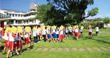
國家防災日-地震避難演練