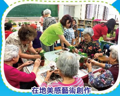
在地美感藝術創作