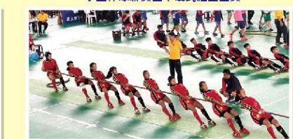
全國各級學校室內拔河錦標賽