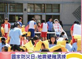
國家防災日-地震避難演練