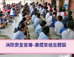
消防安全宣導-濃煙室逃生體驗