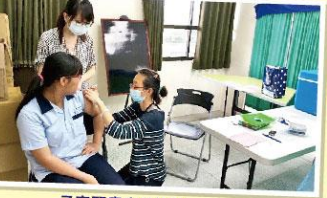
子宮頸癌疫苗注射