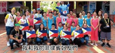
我和我的菲律賓好友們

……，直到最後送機時的依依不捨、互贈禮物、彼此擁抱，相信這門課程讓學生印象深刻。