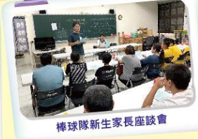
棒球隊新生家長座談會