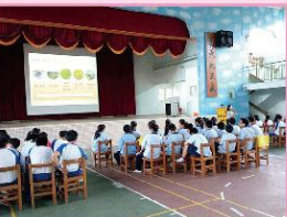
食農講座-認識在地有機米