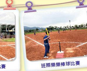
班際樂樂棒球比賽