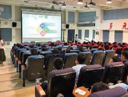
九年級-羅商到校宣導活動