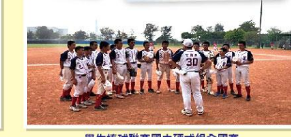
學生棒球聯賽國中硬式組全國賽