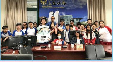
七年級-生涯探索活動-參訪警察局