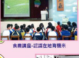
食農講座-認識在地有機米