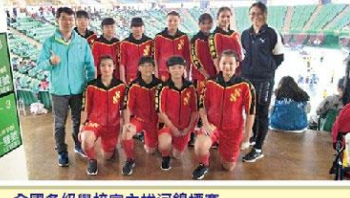
全國各級學校室內拔河錦標賽