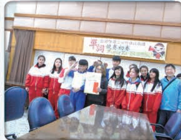
宜蘭縣原住民華詞競賽榮獲泰雅語第二名