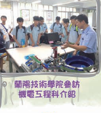
蘭陽技術學院參訪機電工程科介紹