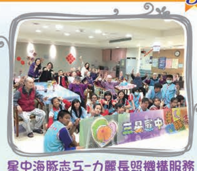
星中海豚志五-力麗長照機構服務