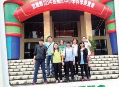
宜蘭縣科學展覽會