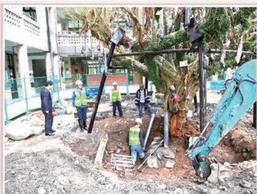
星中搶救老樹行動