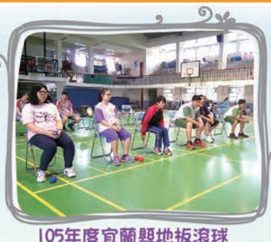
105年度宜蘭縣地板滾球校際巡回友誼賽