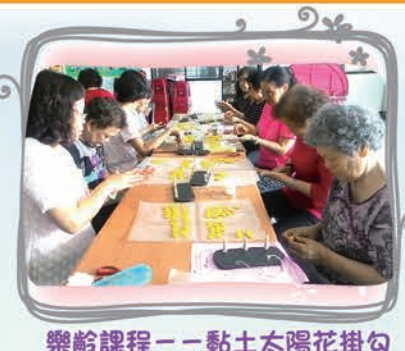
樂齡課程——黏土太陽花掛勾