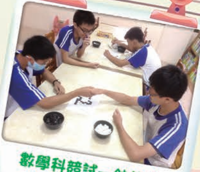
數學科競試一納許棋