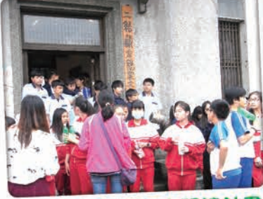
三星鄉內各國中小閱讀計畫(我的平原一書重點參訪活動)