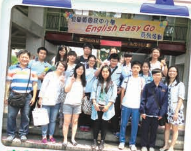
宜蘭縣English Easy Go系列活動