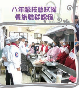
八年級技藝試探餐旅職群課程