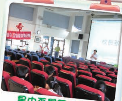
星中盃學藝三鐵人競試活動