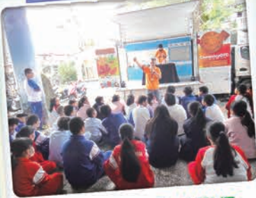
淡江大學化學遊樂趣