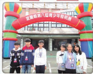
宜蘭縣第八屆青少年發明展