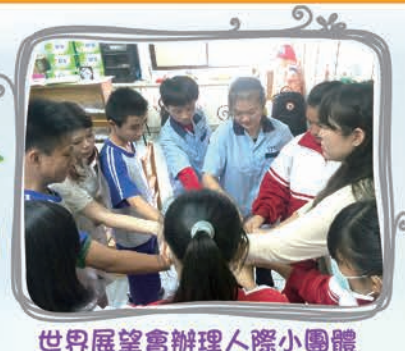
世界展望會辦理人際小團體