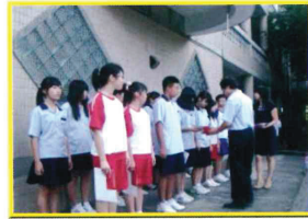
7年級生涯檔案封面競賽頒獎(100下)