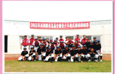
澎湖縣菊島盃青少棒球賽