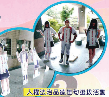
人權法治品德佳句選拔活動