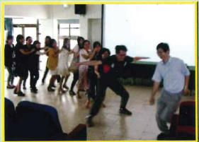
101年度普通班教師暨行政人員特教宣導活動