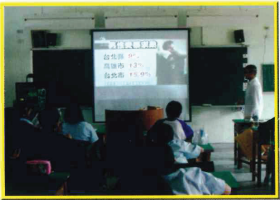
家暴、性侵防治宣導