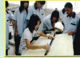
技藝專班-土木建築職群