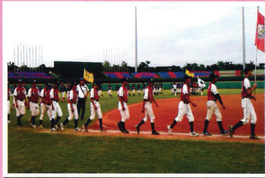
金龍盃青少棒球賽