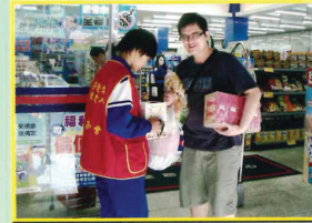
與華山基金會募集發票