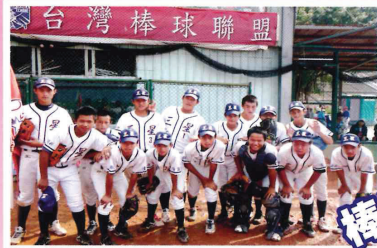
新北市陽明山盃青少棒球賽