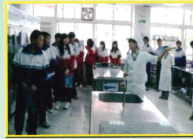
聖護餐飲教室參訪