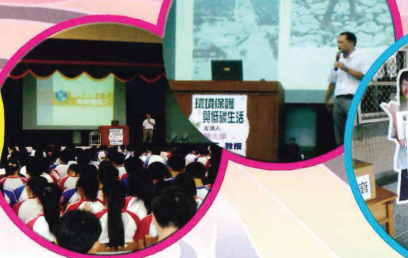
環境教育相關研習-環保與低碳生活研習