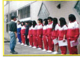
8年級生涯檔案製作比賽頒獎(100下)