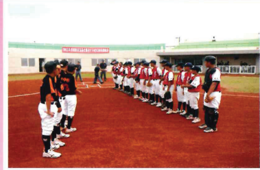
澎湖縣菊島盃青少棒球賽