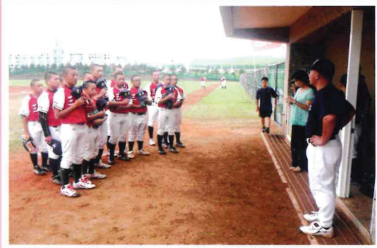
澎湖縣菊島盃青少棒球賽