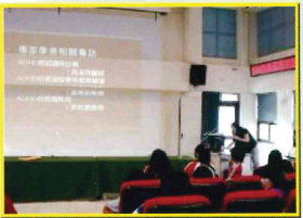
七、八年級學生特教宣導-認識ADHD