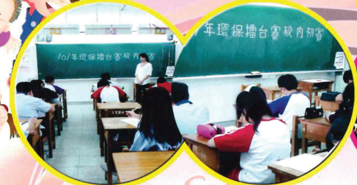
宜蘭縣101年度幸福宜蘭環保智慧王擂台賽校內初賽實況