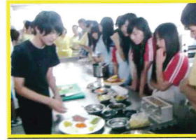
頭城家商餐旅體驗