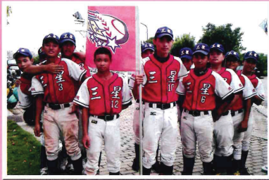
金龍盃青少棒球賽