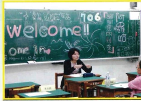
親職座談(親師懇談)