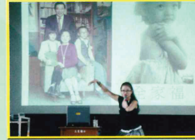
生命典範(獨臂舞者)