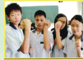
技藝專班-家政職群