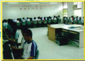
技藝班-商業與管理職群