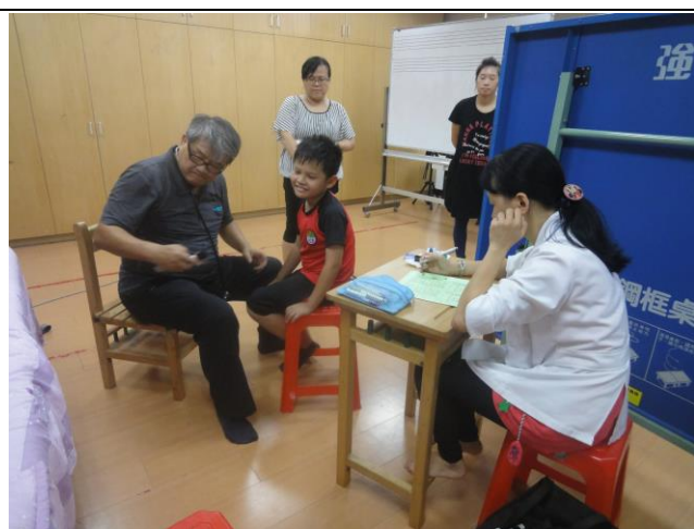
*一、四年級健康檢查(脊柱四肢)。