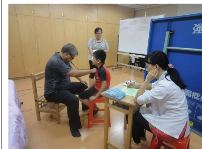
*一、四年級健康檢查(胸部)。。