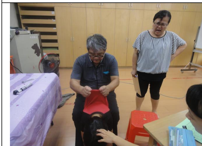
*一、四年級健康檢查(脊柱四肢)。