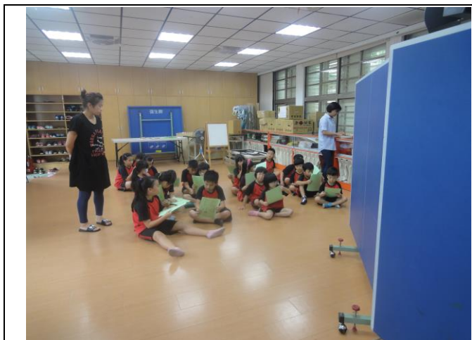
*一、四年級健康檢查(等待區)。