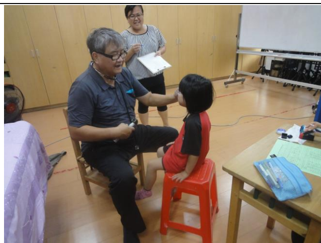
*一、四年級健康檢查(聽力)。