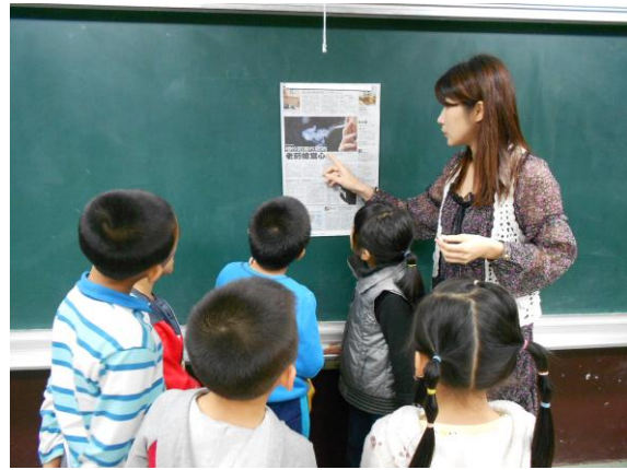
聯合報時事內容介紹