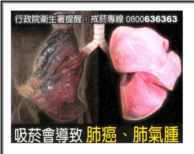
吸菸導致的疾病圖片介紹