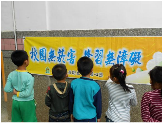
校園無菸害布條講解