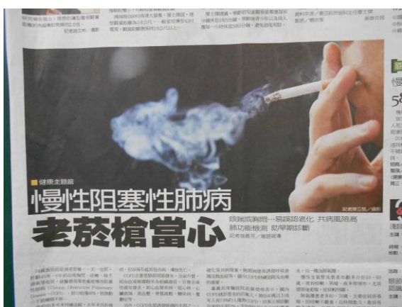
吸菸所導致的慢性病