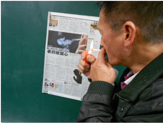
拒吸二手煙 ~ 難聞的煙味