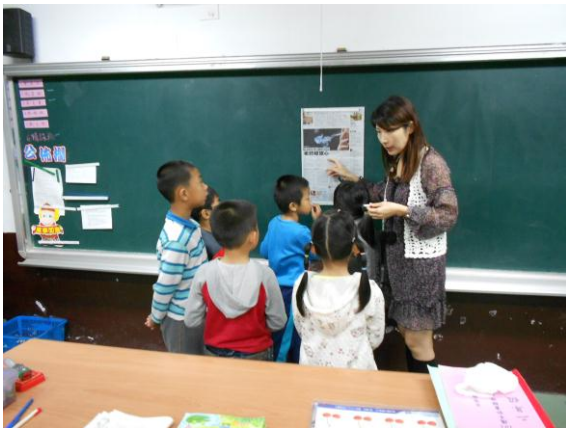
聯合報時事內容介紹