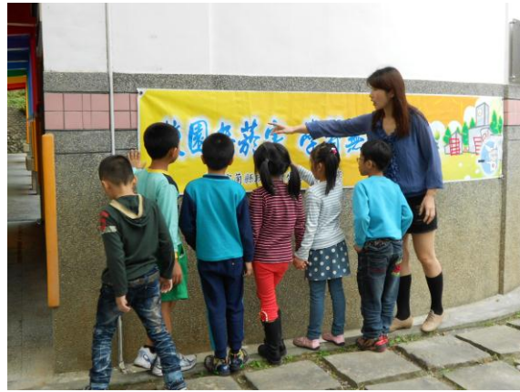
校園無菸害布條講解