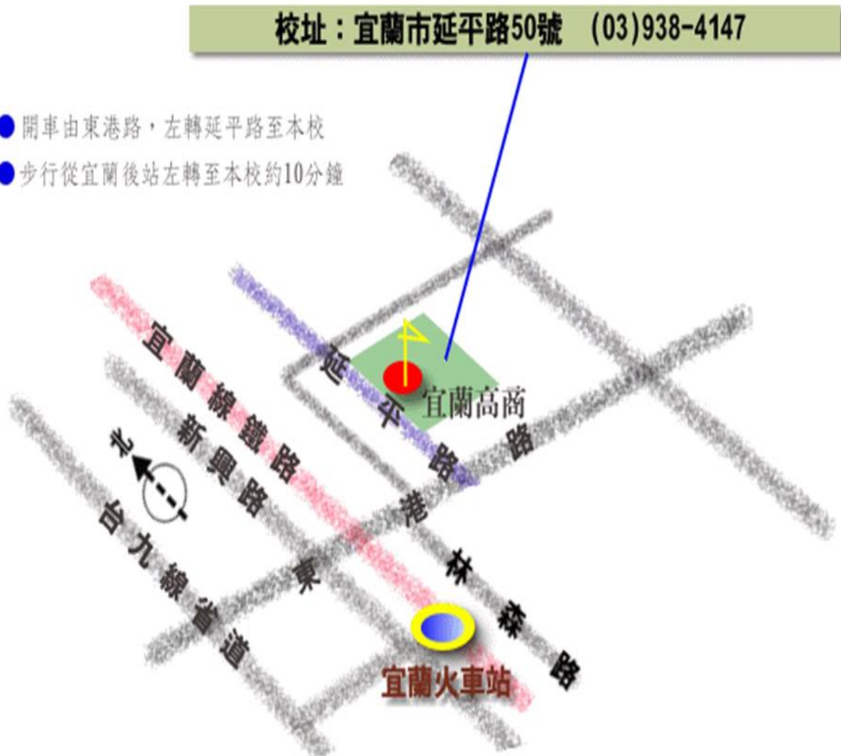
附圖一、承辦學校位置圖