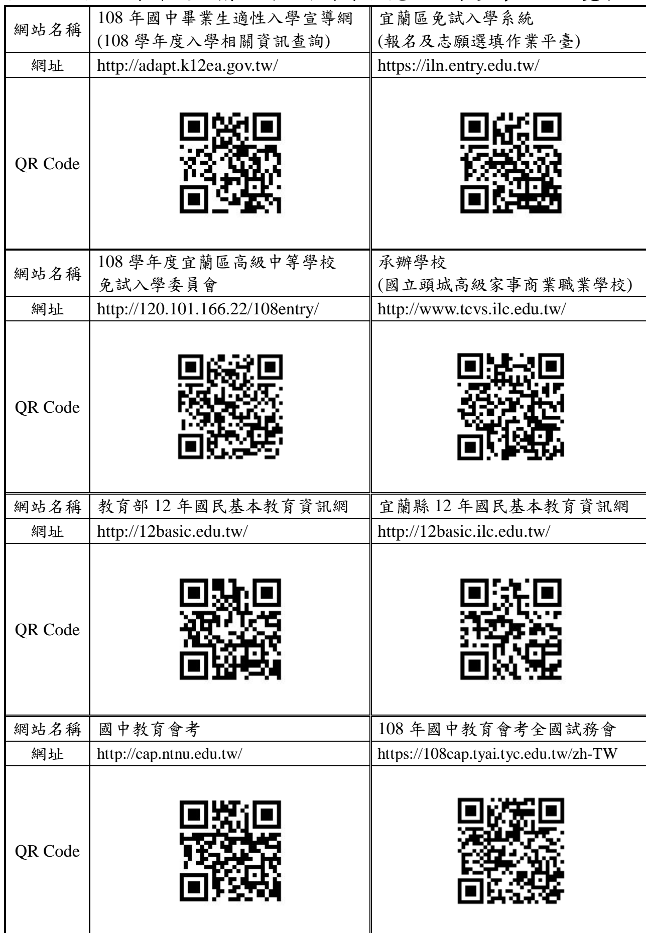
(封面內頁)108 學年度宜蘭區高級中等學校免試入學參考網站一覽表