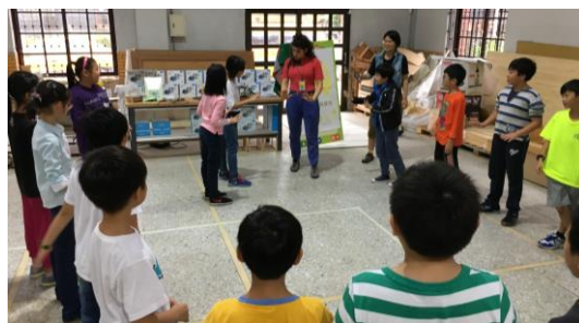
▲學生分組進行「我演你猜」。