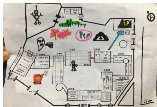
▲學生分組繪製「校園藝奇趣尋寶地圖」。