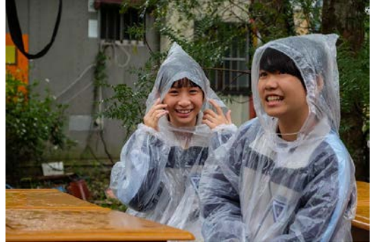
儘管下著雨，卻總是有許多意外的驚喜，無