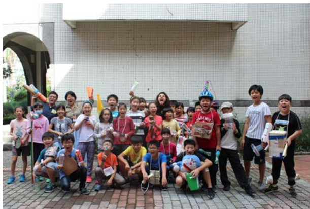
大家運用材料裝飾自己，也為自己的樂器做最後的修改，達到理想中的最佳模樣，每個小