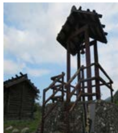
圖 6-6 莎韻之鐘