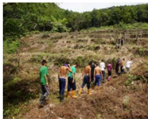
圖 7-1 金岳部落尋根之旅

傳統泰雅族部落有許多祭典，包括播種祭、祖靈祭和收穫祭（粟祭）。不過隨著傳統社會組織及宗教信仰的變遷，南澳鄉目前都難以見到。