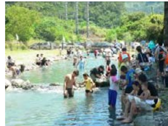
圖 8-2 東澳北溪的東岳冷泉