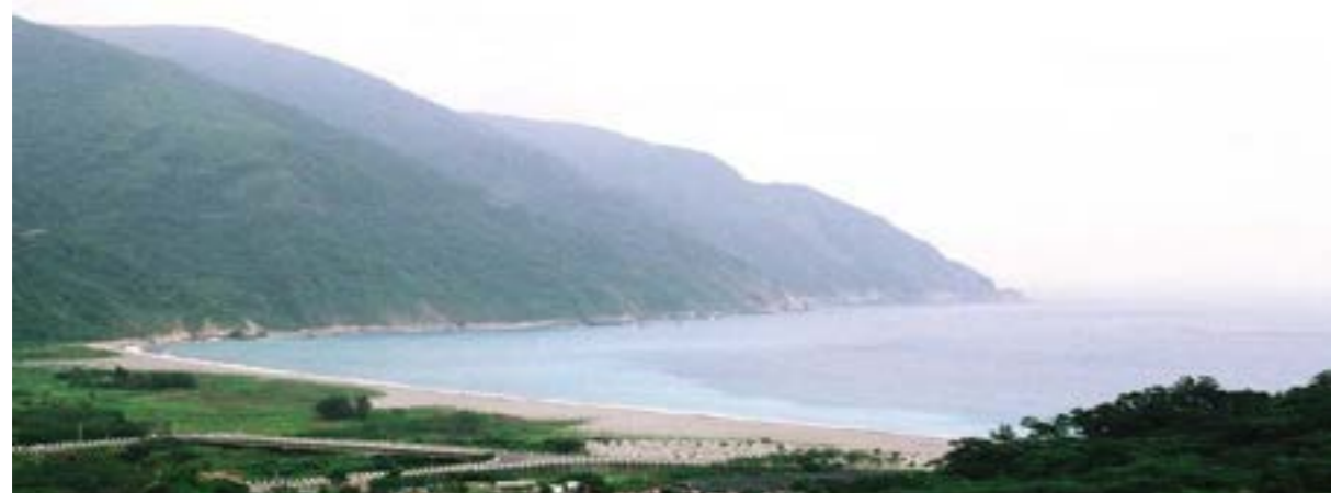
圖 8-4 美麗的東澳灣

南澳東臨太平洋，海洋資源豐富，漢本漁場、朝陽漁港和粉鳥林漁港，除了提供漁產外，更發展出獨特的海洋旅遊文化。