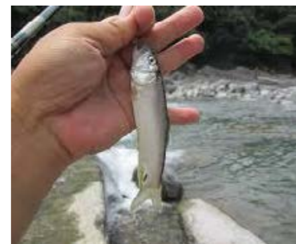
圖 9-2 香魚