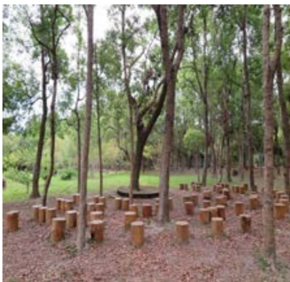
圖 6-2 南澳原生植物園區

南澳鄉的觀光旅遊非常盛行，除了擁具有歷史性的景點外，近年更設立了許多新興名勝，讓來訪的遊客可以參觀到許多不同的景色，也可以體驗當地的文化。