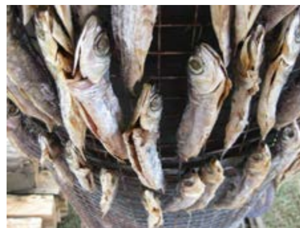
圖 7-3 東岳社區飛魚季