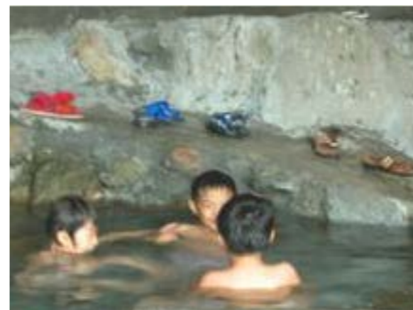
圖 8-1 南澳北溪的四區溫泉

和平溪、南澳南、北溪以及東澳南、北溪不僅提供充沛的水源，同時溪口所形成的三角洲，更形成農業聚落，提供安居樂業的生活空間。而四區溫泉和東澳冷泉更是人們休閒與觀光的重要景點。