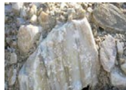
圖 8-3 特有的大理石礦