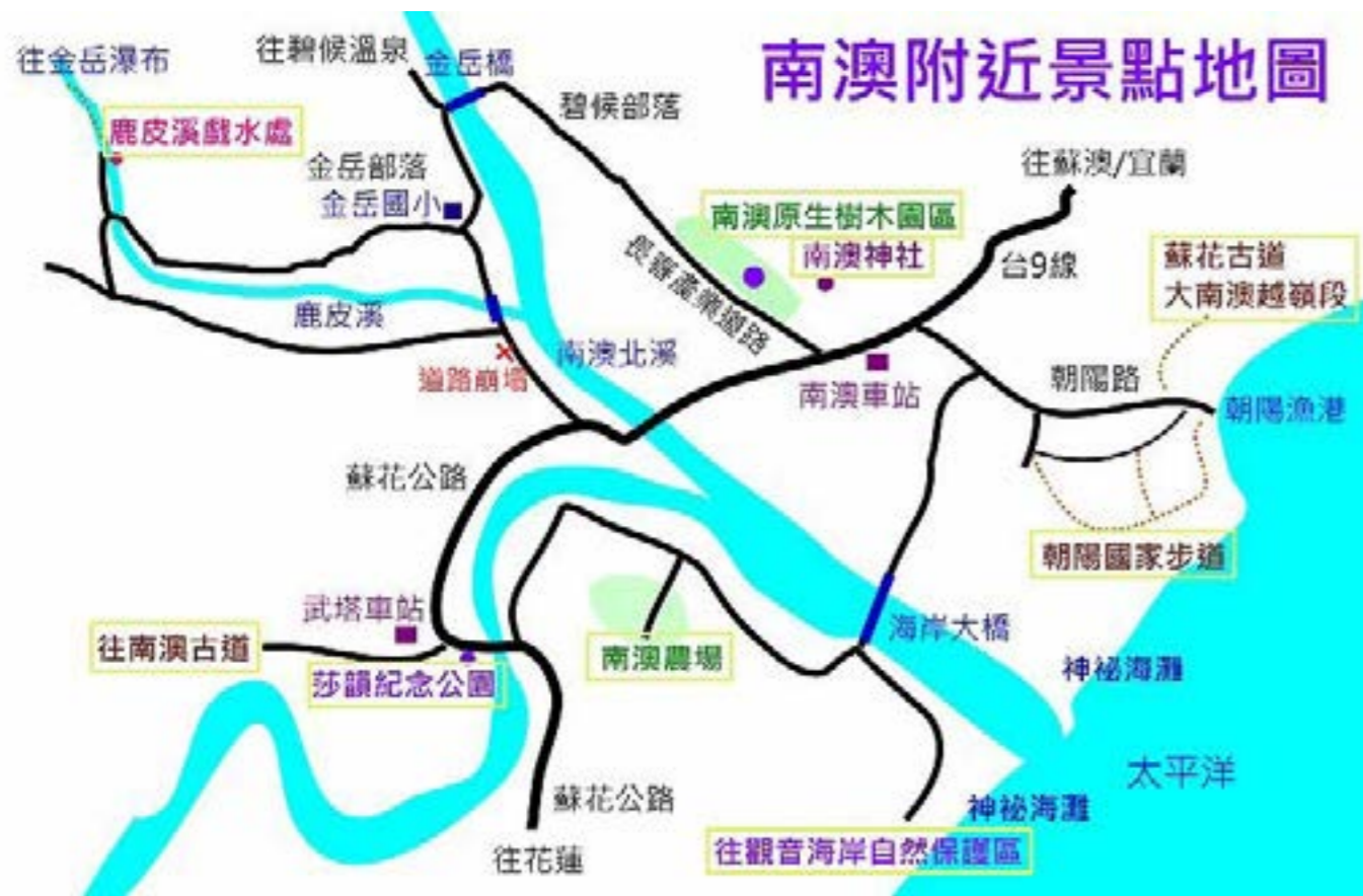
圖 3-4 南澳主要交通道路

透過便捷的交通，我們可以進行旅遊、工作、訪友、貿易和就醫等活動，顯示居民的生活與交通是密不可分的。