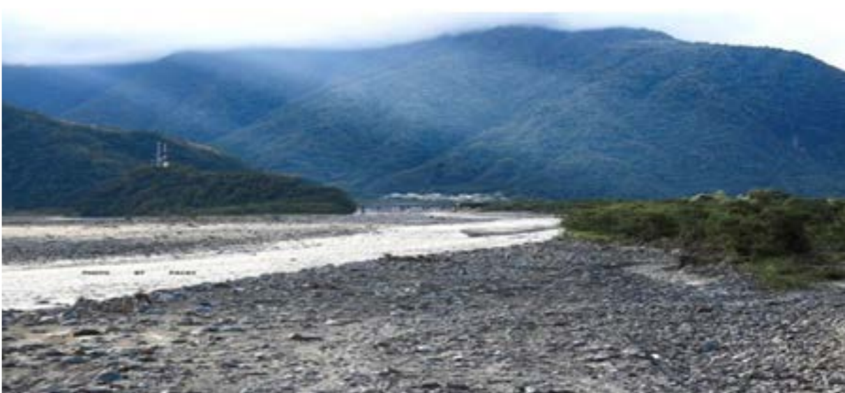
圖 2-2 南澳鄉溪流