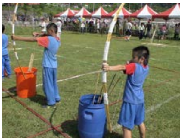
圖 7-3 南澳鄉傳統技藝競賽