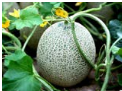
圖 9-3 哈密瓜

南澳鄉族人運用山麓的地勢及氣候，種植香菇、枇杷、文旦、鳳梨、哈密瓜、洋香瓜、西瓜、辣椒和生薑等作物。