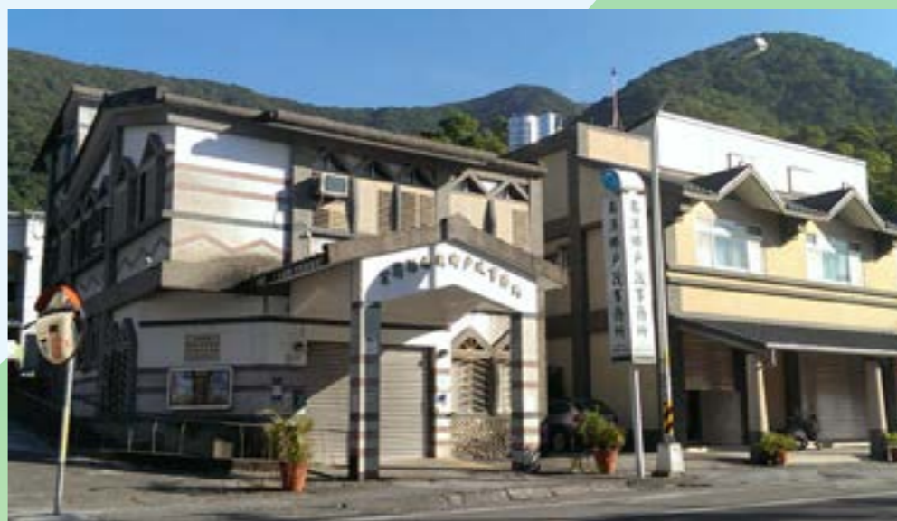
圖 3-3 戶政事務所