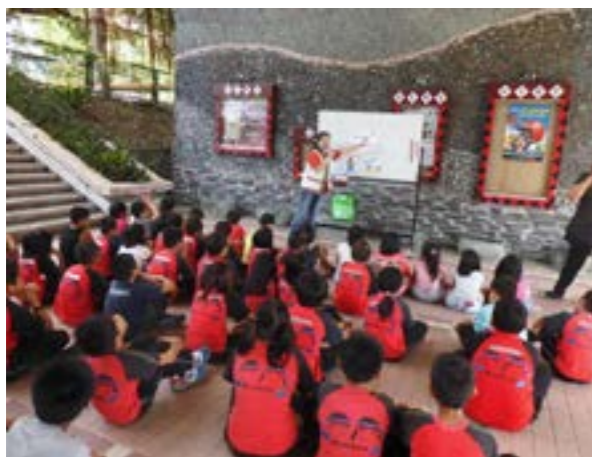
圖 10-2 學校母語教學