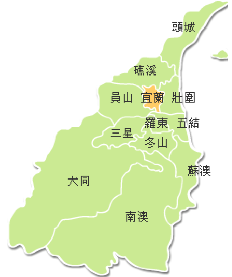
圖 4-1 宜蘭縣行政區域圖