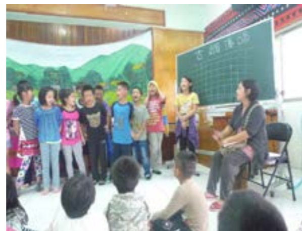
圖 10-3 部落古調傳唱

但是，雪隧的開通以及宜蘭、花蓮縣市觀光發展興盛，往來的遊客非常多，每逢假日都造成部落交通阻塞。也有許多民眾到部落遊玩，卻留下了不必要的垃圾，因此交通問題以及部落自然生態的管制需要重新檢視與解決。