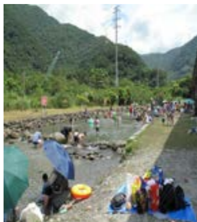
圖 6-4 東澳湧泉