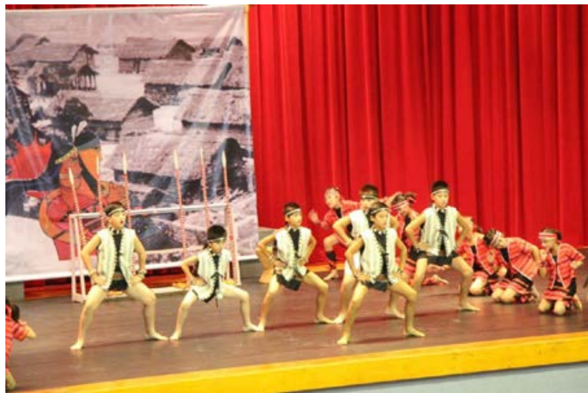
圖 7-4 學童以傳統舞蹈參加全國學生舞蹈比賽