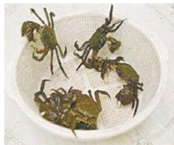
圖 9-1 青毛蟹

南澳溪分為南溪、北溪兩大支流，其間交會之生態系統孕育了不少水棲生物，其中包括瀕臨絕種的青毛蟹及香魚。