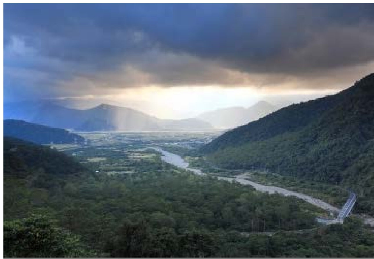
圖 1-2 南澳鄉三面環山

南澳鄉地形以山地為主，三面環山東臨太平洋，境內最高山為南湖大山，主要溪流有東澳溪、大南澳溪以及和平溪，東流入太平洋，層層山脈和溪流是南澳鄉的景觀特色。