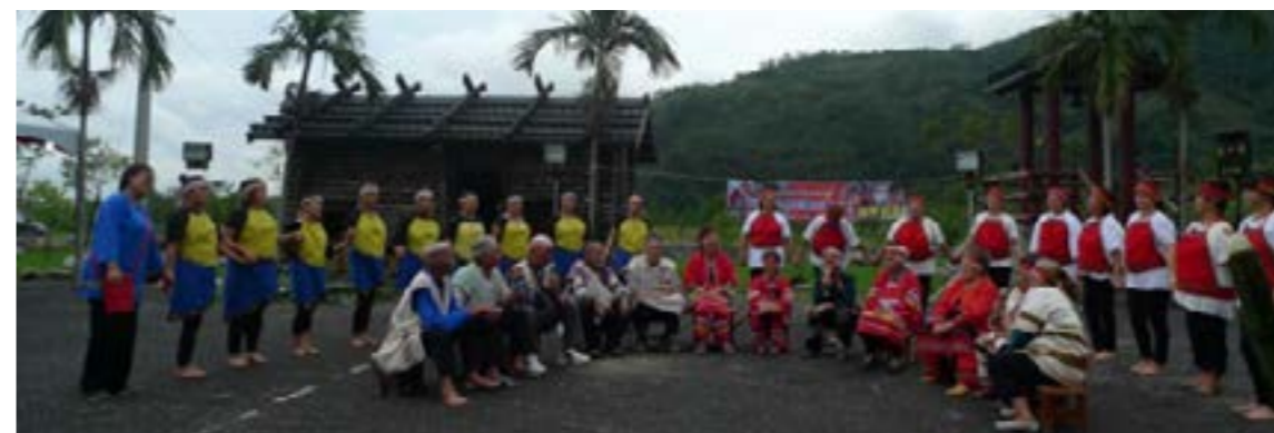
圖 10-1 部落協會舉辦文化活動

為了推展及維護南澳泰雅族文化與自然景觀，政府、社區及學校單位合力推動相關措施，如成立原住民事務所推行部落事務、在學校推動母語教學、成立部落相關協會以及廣設各鄉鎮文物館等等。