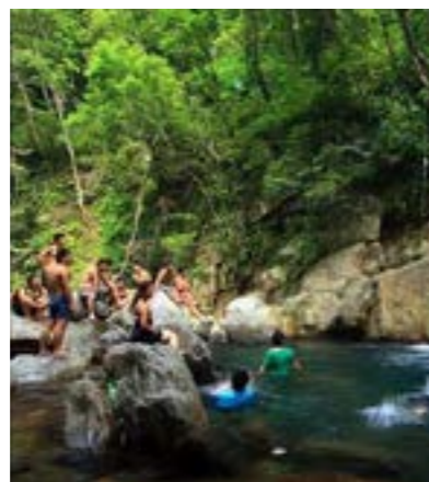
圖 6-5 金岳瀑布