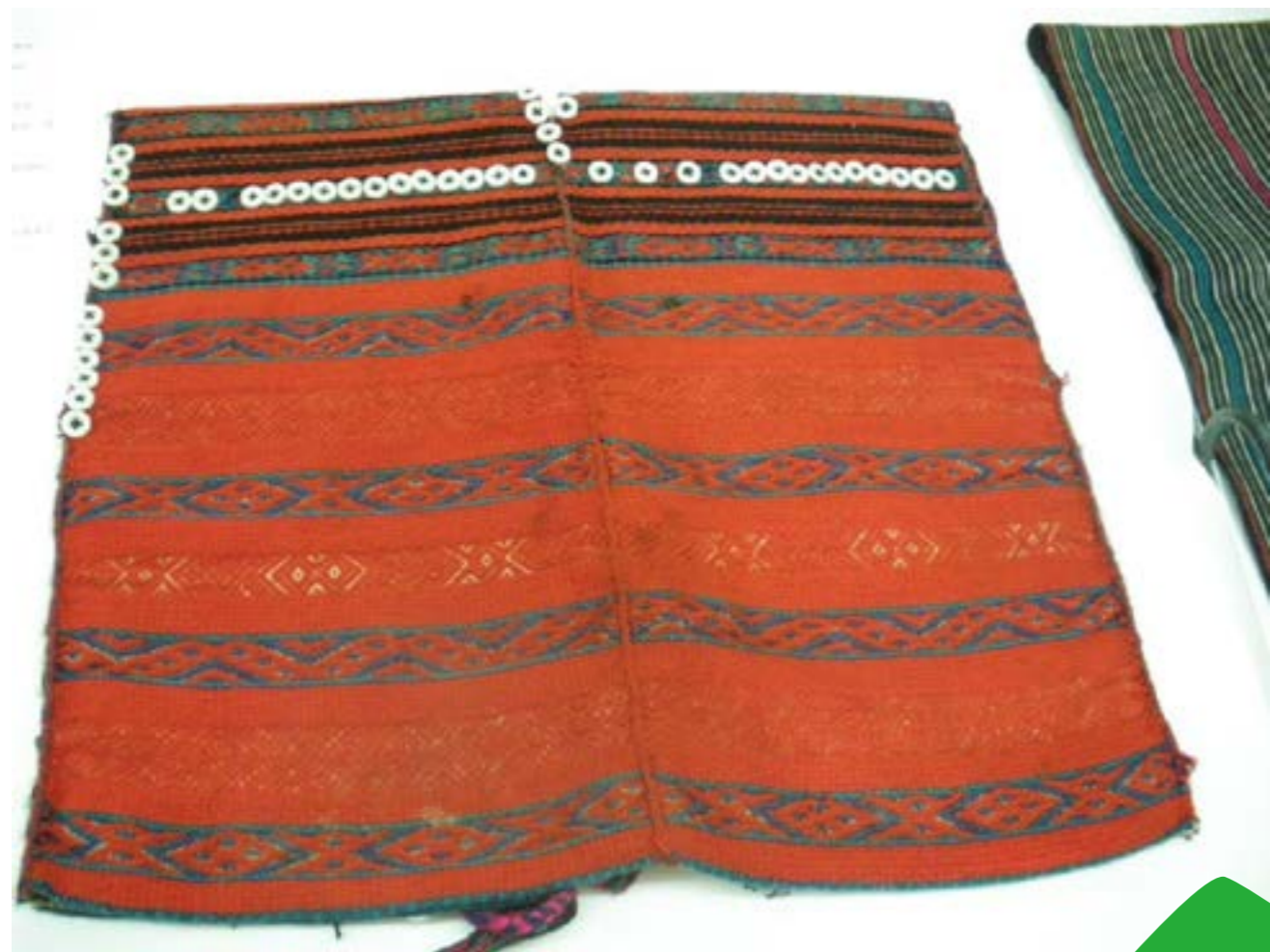
圖 5-4 泰雅族織布特色

名勝就是大自然優美的景觀或人工開闢的風景區，而能吸引人們參觀遊覽的地方。過去先民生活過程中建造建築，代代流傳，經政府指定者即為古蹟。