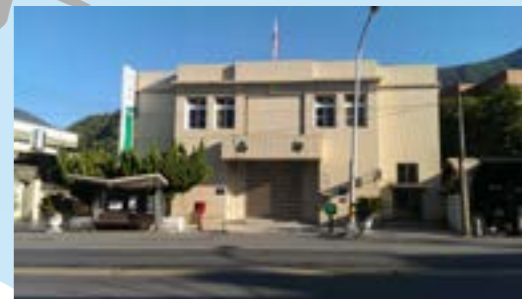
圖 3-2 南澳車站

包括鄉公所、戶政事務所、衛生所和醫療站等，皆集中在車站附近，可想而知南澳車站對南澳的發展是多麼重要的。