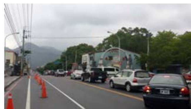
圖 10-4 部落假日交通壅塞

但是，雪隧的開通以及宜蘭、花蓮縣市觀光發展興盛，往來的遊客非常多，每逢假日都造成部落交通阻塞。也有許多民眾到部落遊玩，卻留下了不必要的垃圾，因此交通問題以及部落自然生態的管制需要重新檢視與解決。