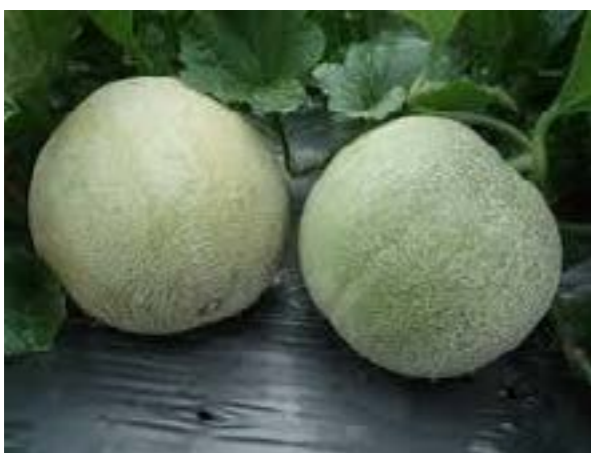
圖 9-4 洋香瓜