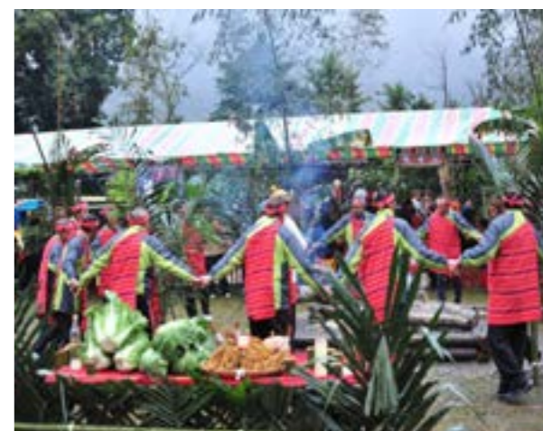
圖 7-2 泰雅族祖靈祭

取而代之的是鄉公所或鄉內民間組織舉辦泰雅民俗節慶活動，或是具有紀念性質的地方活動，是讓大家再度重視並了解泰雅文化的好