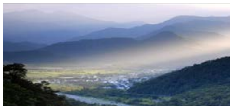
圖 2-1 南澳鄉地形山貌

南澳鄉地勢由東向西漸升高，有平原、丘陵和山地組合而成，及西向東溪流穿梭於山間，最後流向 太平洋 。