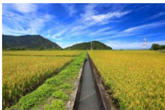
圖 2-3 南澳鄉稻田

陡，就近打獵。雖受到地形限制，但礦產豐富，有 東澳 的幸福水泥工廠、 澳花 的電廠及溪流砂石搬運。居民除了從事農業和打獵外，大部分以工廠作業員和卡車司機維生。配合地形變化，產生多樣化的工作型態。