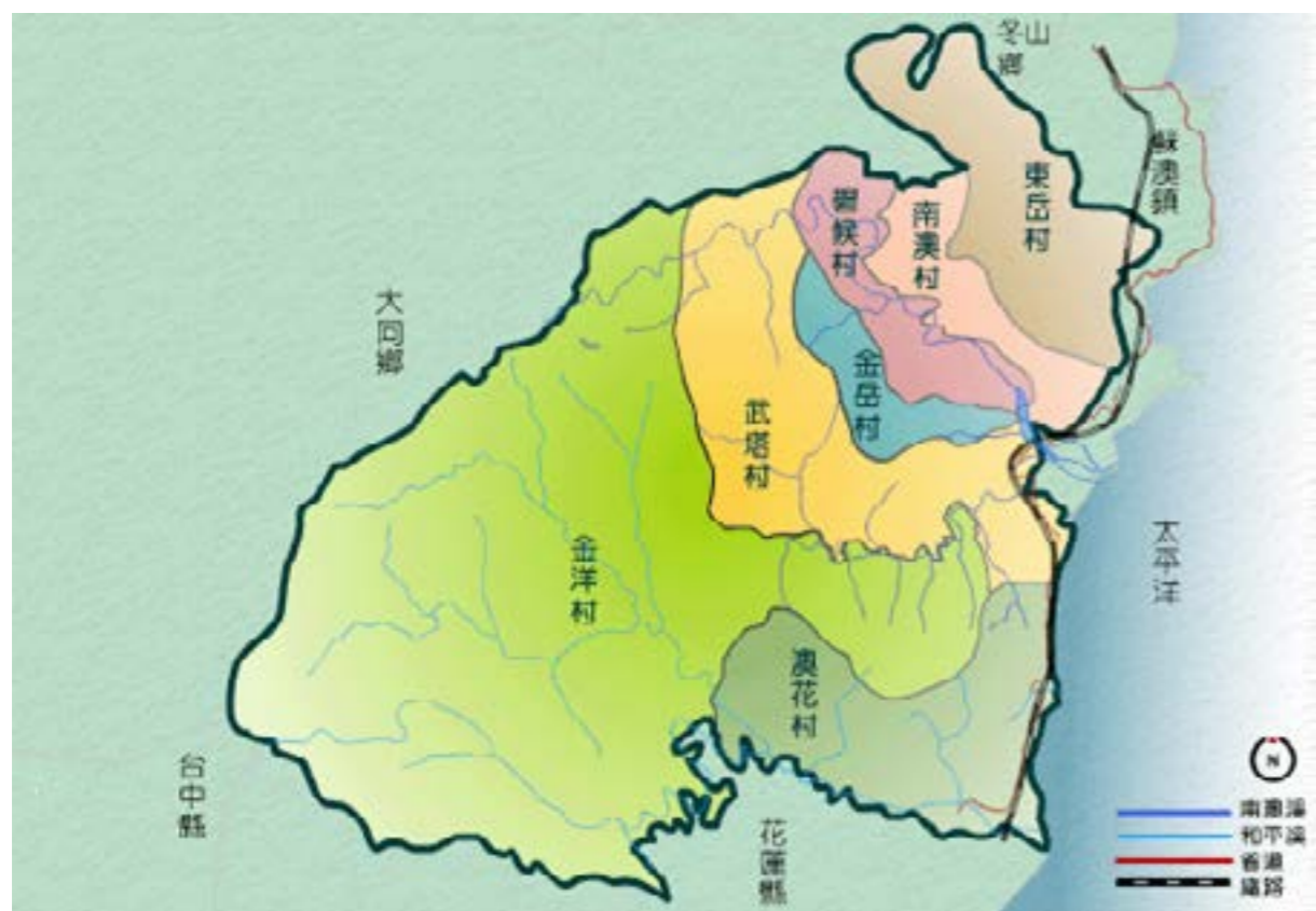
圖 1-3 南澳鄉行政區區域圖

南澳鄉共有 七個村落 ，從北到南依序是 東澳村 、 南澳村 、 碧候村 、 金岳村 、 武塔村 、 澳花村 。