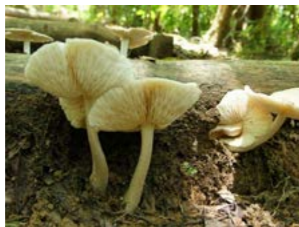
圖 9-5 香菇