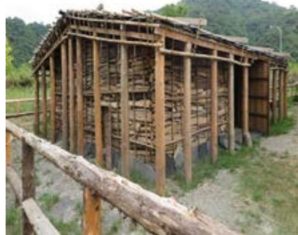
圖 6-3 泰雅族南澳大山部落學校