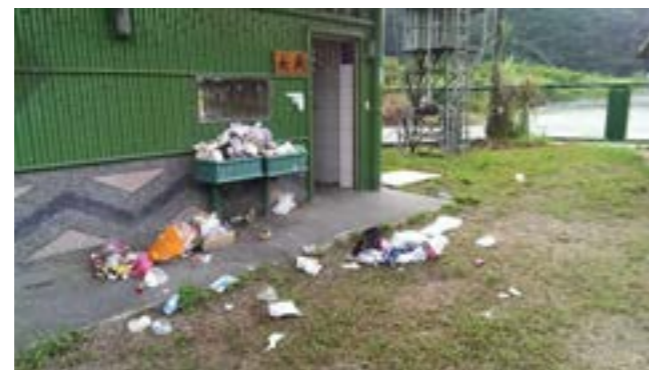
圖 10-5 東澳冷泉環境的破壞