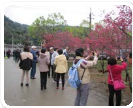
圖 10-5：每年二、三月間櫻花祭

大同鄉每年結合鄉公所與各部落社區協會，定期舉辦活動，例如：櫻花祭、泰雅文化情、鄉村運動會、產業文化博覽會和傳統歲時祭儀等。透過這些活動讓遊客們認識我們的文化，最重要就是尊重傳統習俗，並以學習的態度走遍大同鄉每一個角落。