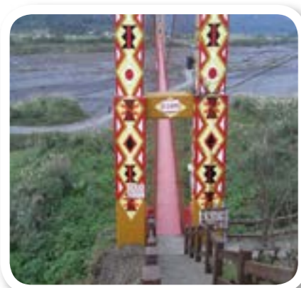
圖 8-1: 寒溪村吊橋。