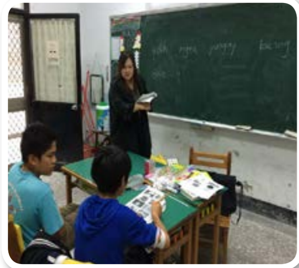
圖 6-1：族語教學：泰雅族 gaga 的文化復興運動之一。