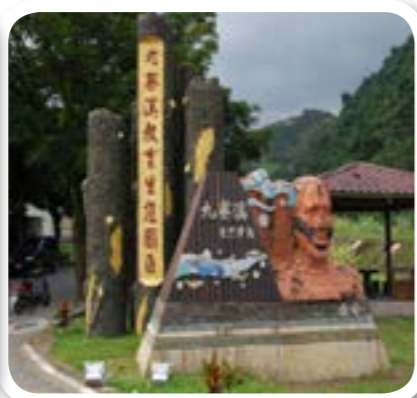
圖 8-2: 崙埤村九寶溪生態園區。