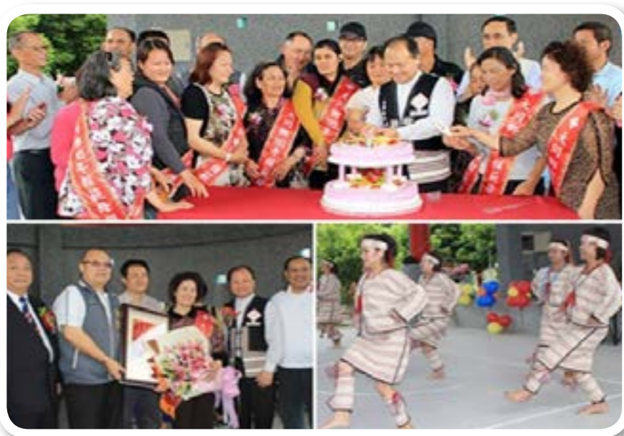
圖 2-2：大同鄉的活動。鄉內辦理模範母親、模範父親的頒獎典禮。

往大同鄉的交通有兩種路線，一是自行開車前往，從宜蘭市沿著 台七線 往南山方向，沿途經過 崙埤 、 玉蘭 、 松羅 、 英士 、 棲蘭 、 獨立山 、 嘉蘭 、 茂安 、 四季 、 南山 ；二是從 羅東鎮 經 三星 往南，沿著 台七丙線 可經過 復興 、 牛鬥 接 台七甲線 。 寒溪部落 經 梅花路 可到達。