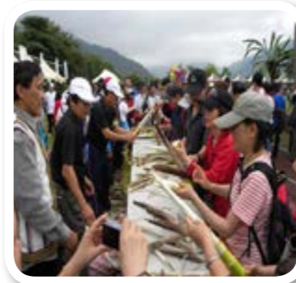
圖 8-7: 樂水村桂竹筍生態區。