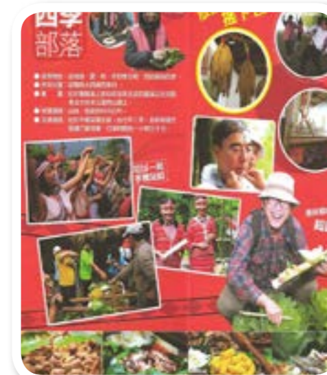
圖 7-7: 協會文化宣傳海報。