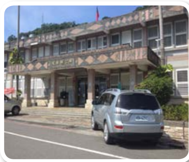
圖 4-3：大同鄉公所。是 大同鄉 行政機關。