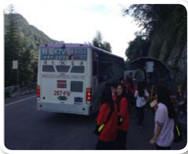
圖 3-4：公車站牌，扮演鄉內學生通車上學及鄉民下山採購很重要的功能。

大同鄉有許多為鄉民服務的機關，如大同鄉鄉民代表會，是大同鄉的民意機關。而大同鄉公所、警察局、消防隊、圖書館和戶政事務所等，更為鄉民提供各種不一樣的服務。