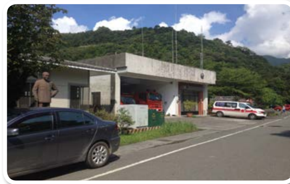
圖 4-1：大同鄉消防隊負責大同鄉內防震防災的工作。

大同鄉有許多為鄉民服務的機關，如大同鄉鄉民代表會，是大同鄉的民意機關。而大同鄉公所、警察局、消防隊、圖書館和戶政事務所等，更為鄉民提供各種不一樣的服務。