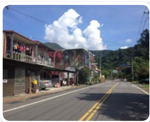
圖 3-2：台七線。途中經過鄉內部落，為鄉內重要道路。

如果不想開車，大同鄉也有客運可以搭乘，目前國光客運，可從宜蘭市或羅東鎮，沿途停靠各個部落。雖然班次較少，但確實讓許多觀光客及部落居民，以往來旅遊和辦理事務。