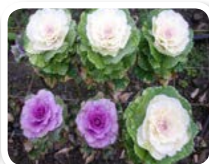
圖 7-6: 葉牡丹。

為了傳承我們的文化(gaga)，村落成立部落發展協會，推展當地的文化特色和部落生態旅遊，增進族群之間的文化交流。