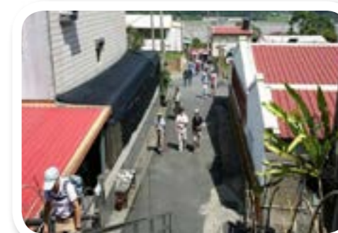
圖 7-9: 部落巡禮。