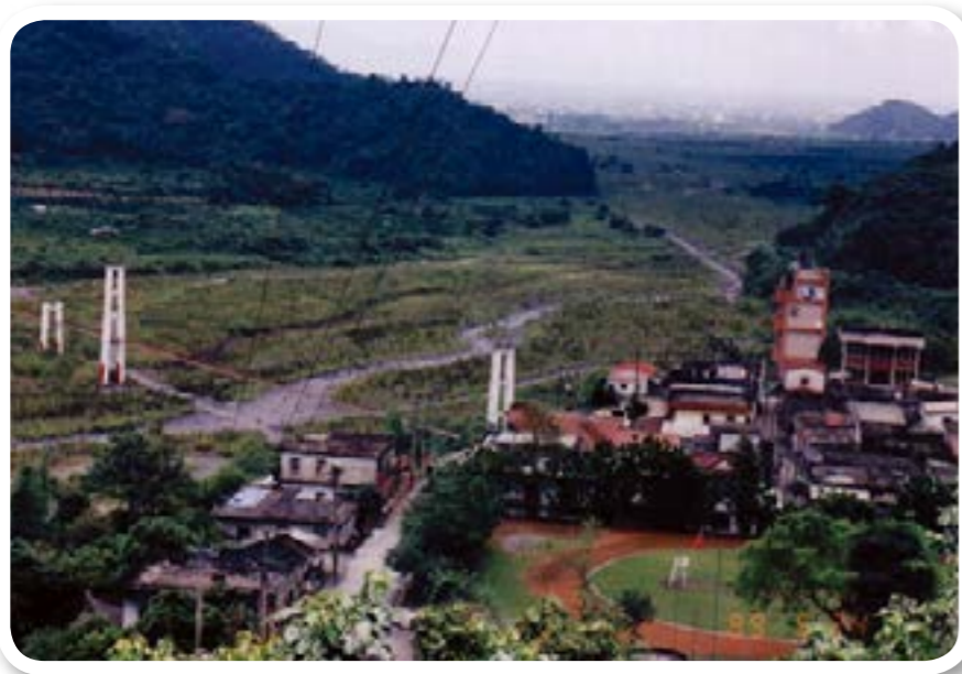
圖 2-3：寒溪部落。風景秀麗、鳥語花香。