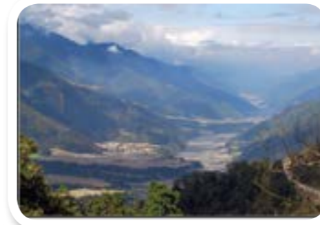
圖 1-3：蘭陽溪。蘭陽溪中上游。

大同鄉位於 宜蘭縣 西南部，境內面積約 768.1 平方公里，人口數約有 五千七百 多人，共分為 十 個村，包括： 寒溪村 、 崙埤村 、 松羅村 、 復興村 、 英士村 、 樂水村 、 太平村 、 茂安村 、 四季村 、 南山村 ，居民均為 台灣原住民 泰雅族群 。