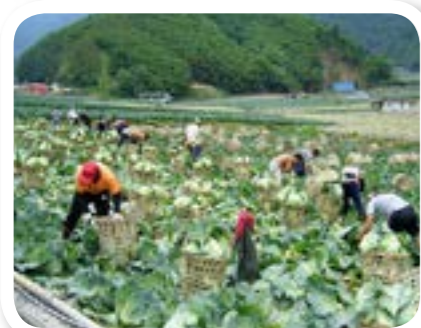
圖 7-1: 甘藍菜。

部落的村民大多從事農業，種植的農作物有：甘藍菜、包心白菜、柑桔、茶葉、紅肉李、西瓜和桂竹筍等。近年來來政府輔導村民種植花卉，代替傳統農作物，不只增進村民的專業技能，也帶來了新一番新氣象。