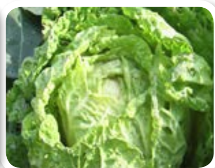
圖 7-2: 包心白菜。