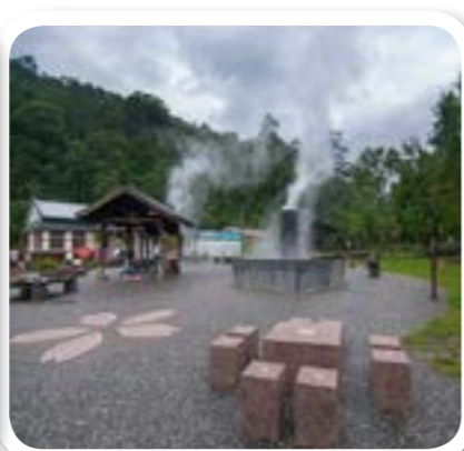
圖 8-5: 復興村清水地熱。