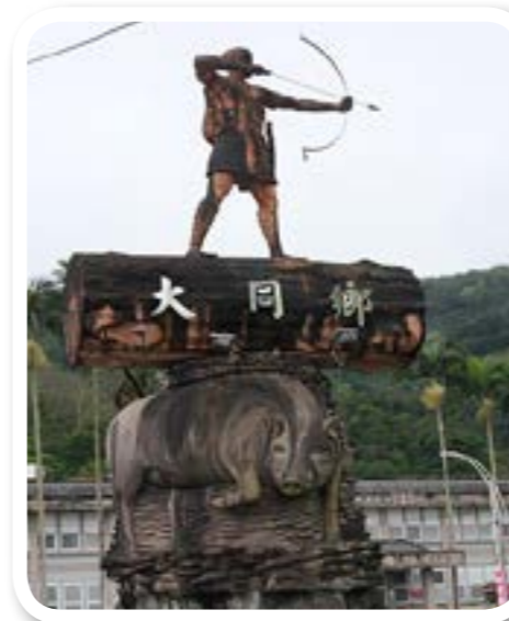
圖 1-2：大同鄉的精神標誌。位於大同鄉公所前。