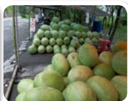
圖 7-5: 西瓜。