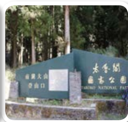
圖 8-11: 南山村南湖大山登山步道。