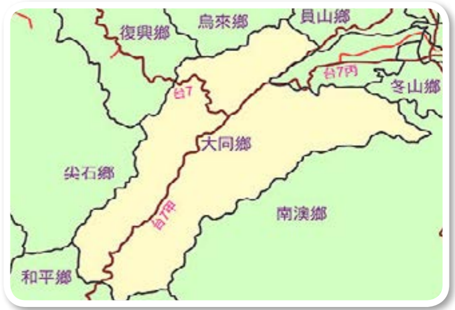
圖 2-1：大同鄉地理位置圖。