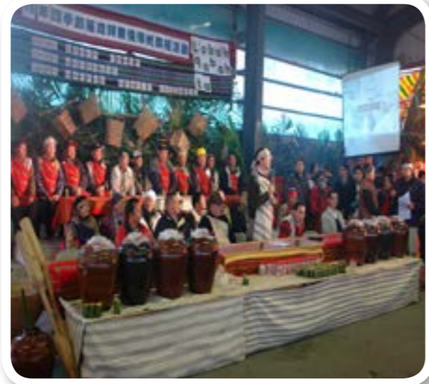
圖 6-2：祖靈祭：泰雅族 gaga 的文化復興運動之二。

在社會變遷的巨輪下，泰雅族的社會組織 gaga 逐漸沒落，族群中的習俗、文化及規範不受重視。然而，近年來在政府及民間團體的振興運動下，泰雅族的社會組織重新地被重視，燃起泰雅族社會中 gaga 的傳承和重生。