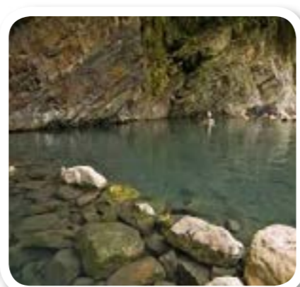
圖 8-6: 英士村禁禁野溪溫泉。