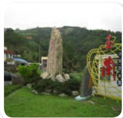
圖 8-4: 松羅村玉蘭休閒農業區。