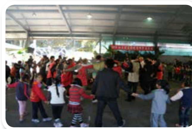
圖 9-5：祖靈祭意義是族人要承諾祖靈遵守傳統。