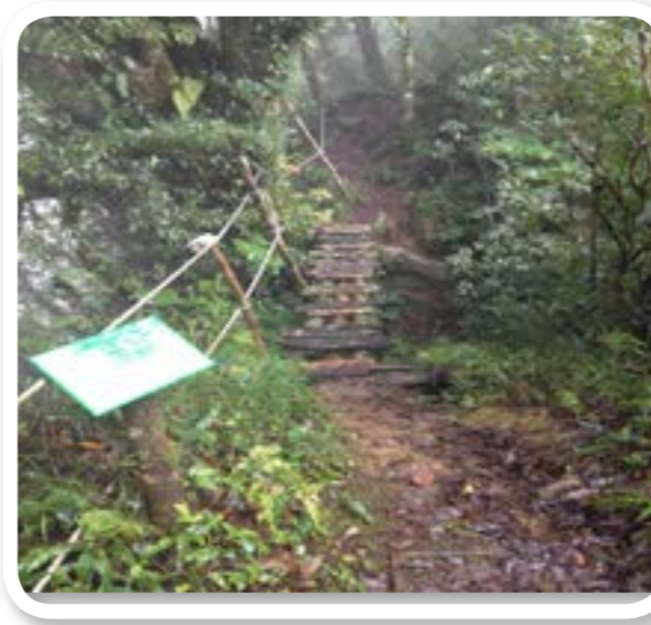
圖 10-1：比亞楠檜木步道

宜蘭縣大同鄉擁有豐富的山林資源與人文歷史，目前已有許多遊客前來觀光與旅遊，讓大家認識大同鄉的美。