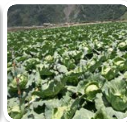
圖 8-9: 茂安村嘉蘭蔬菜專業區。