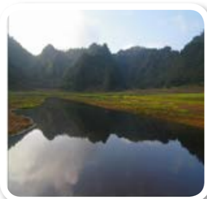
圖 8-3: 松羅村松羅湖。