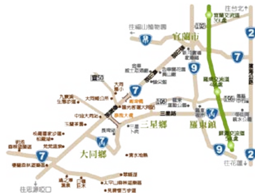
圖 3-1：大同鄉交通圖。大同鄉的交通主要以台七線及台七甲線。