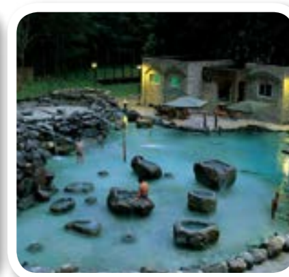
圖 8-12: 太平村鳩之澤溫泉。

大同鄉境內到處充滿綠意，環境清雅，處處鳥語花香，尤其地方資源豐富，更具特色。因此，原鄉之 泰雅風情 及 好山好水 ，便成為大同鄉發展之優勢。