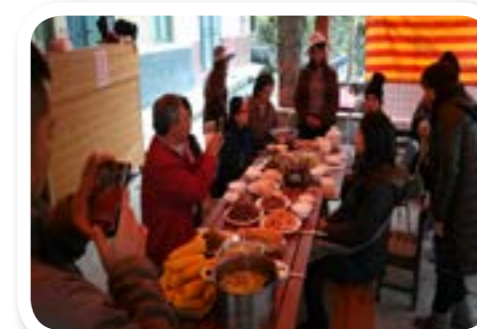
圖 7-8: 部落美食饗宴。