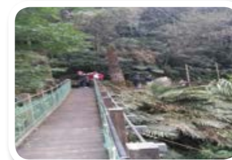
圖 7-10: 部落古蹟健走。