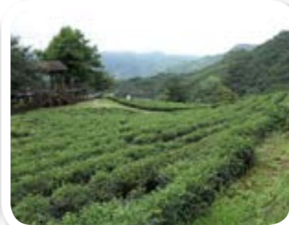
圖 7-3: 茶葉。