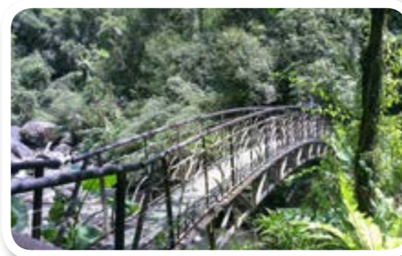
圖 10-3：九寮溪教育生態園區