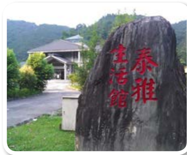
圖 5-1 泰雅生活館。