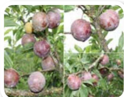
圖 7-4: 紅肉李。