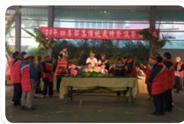
圖 9-4：泰雅族宗教信仰主要為祖靈。