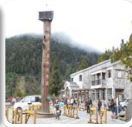
圖 8-8: 太平村太平山森林遊憩區。