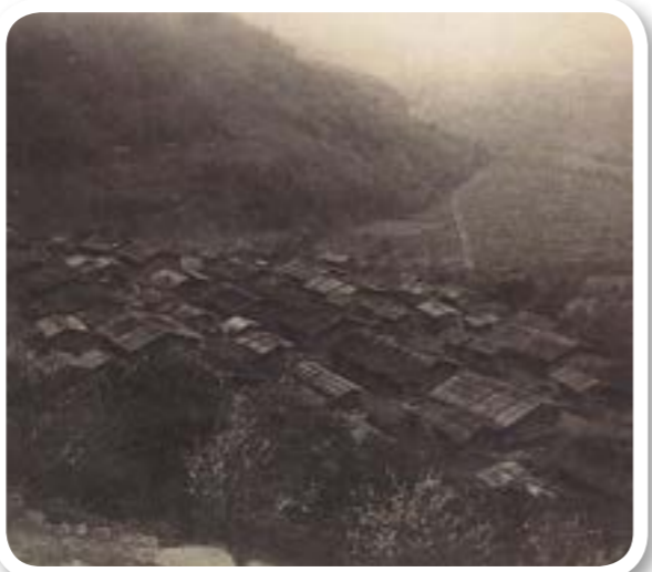
圖 1-6：日治時期四季部落。住家多採木造房屋。