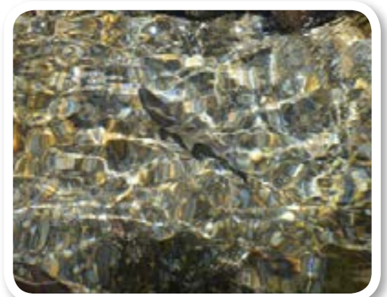
圖 10-2：羅葉尾溪：櫻花鉤吻鮭