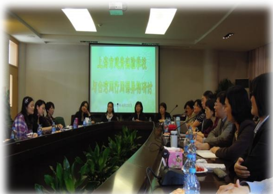
上海建青實驗學校