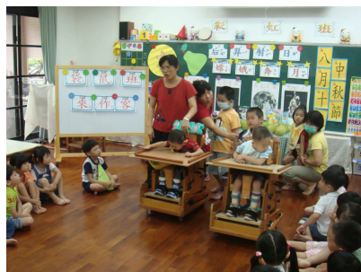
特教宣導：小傑和多多班幼兒打招呼