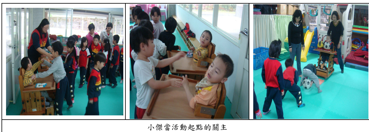
小傑當活動起點的關主

兩次擔任關主確實可增加小傑和大家的互動，效果不錯，但仍是在旁邊看著，屬於「點狀參與」，離理想中的融合有一段距離，透過調整活動層次讓小傑一起玩，相信小傑會很喜歡（討 1001121）。