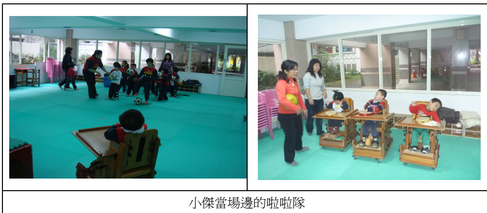
小傑當場邊的啦啦隊