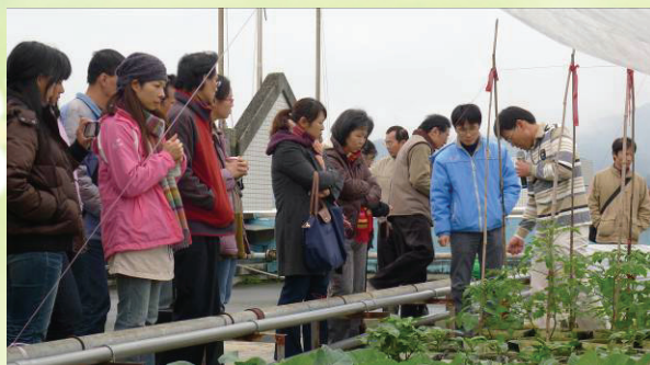
▲100. 12. 23 環境教育研習老師參觀