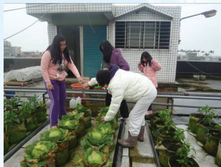
▲採收高麗菜提供包水餃食用