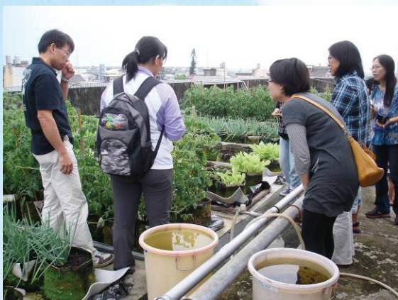
▲101. 09. 29 在地食材研習家長參觀