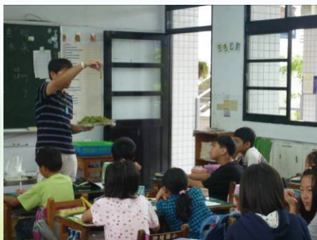
▲毛豆莢提供社團學生享用