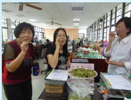
▲和同事分享毛豆莢