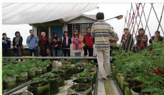
▲100. 12. 23 環境教育研習老師參觀