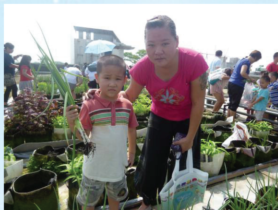
▲101. 08. 30 一年級新生家長參觀