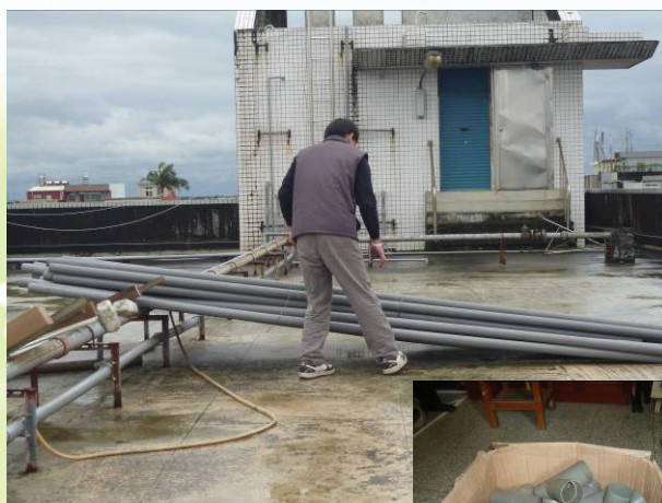
▲2英吋舊水管及彎頭