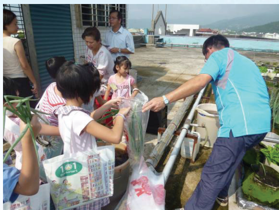
▲101. 08. 30 一年級新生家長參觀