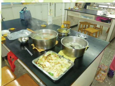
▲高麗菜水餃、蔬菜湯