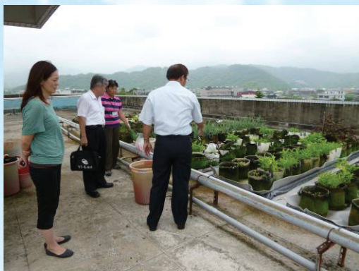
▲101. 08. 30 教育處長參觀