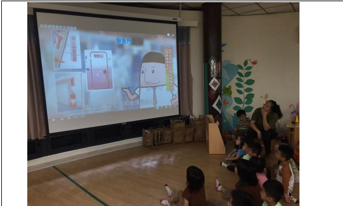
說明:校外教學前交通安全介紹