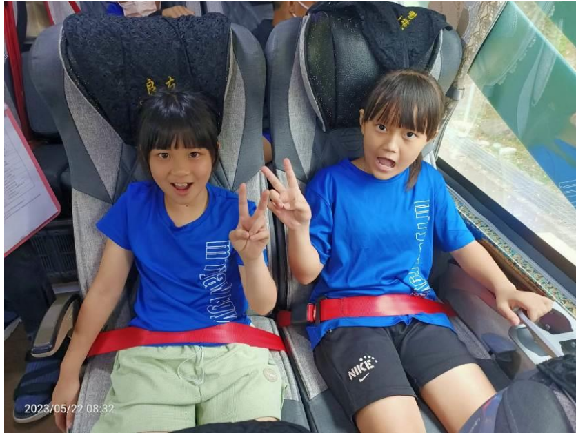
說明：學生繫上安全帶