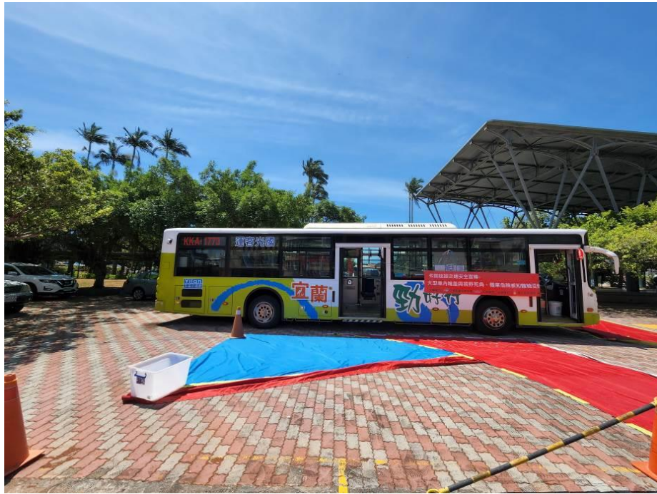
大公車內輪差區域