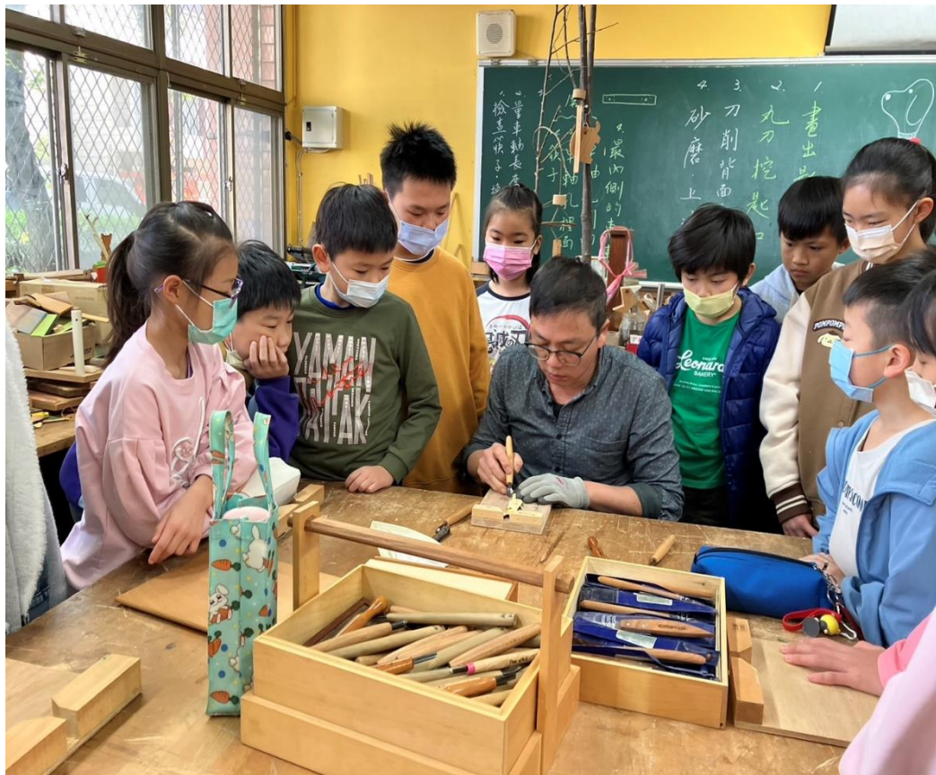
活動：治具操作要領解說示範與安全宣導