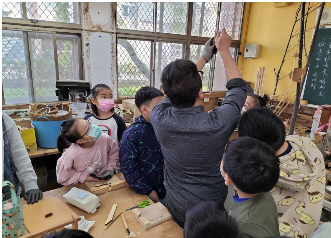
活動：砂磨匙口及各部砂磨示範