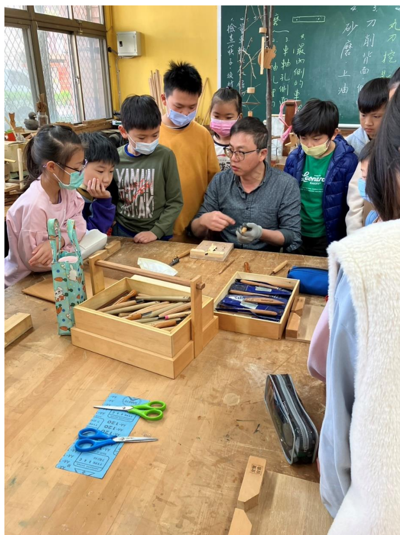
活動：操作要領解說示範與安全宣導