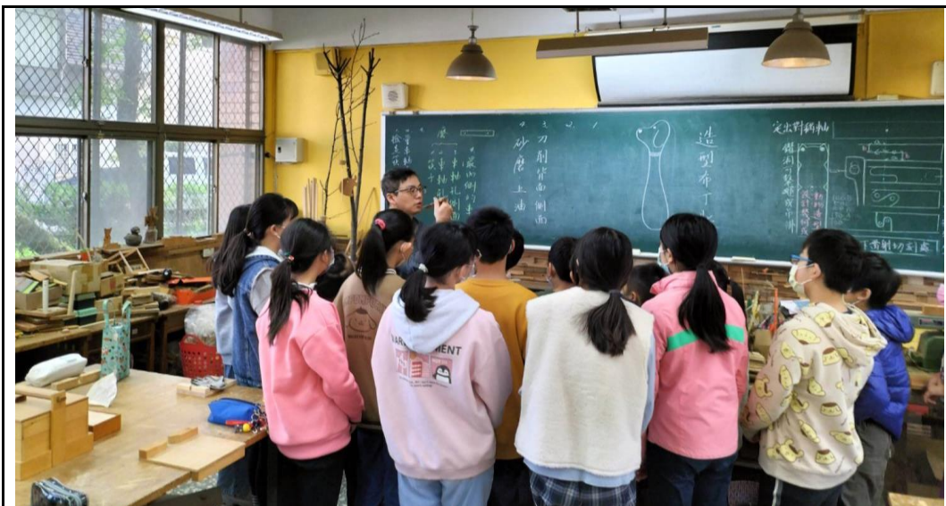
活動：用木匙食用布丁，說明各部名稱，引起動機