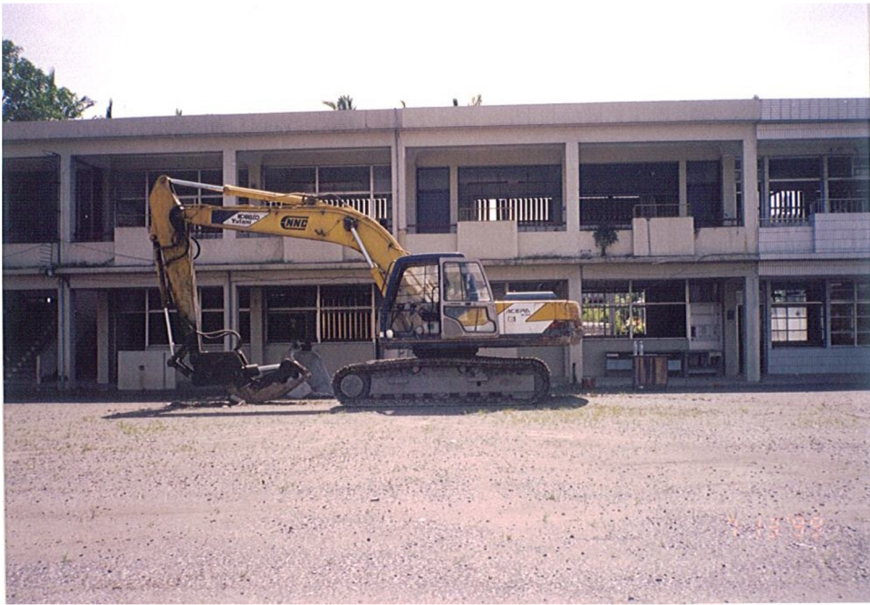
大約為民國 85 年拆除原福利社及廚房旁的舊教室