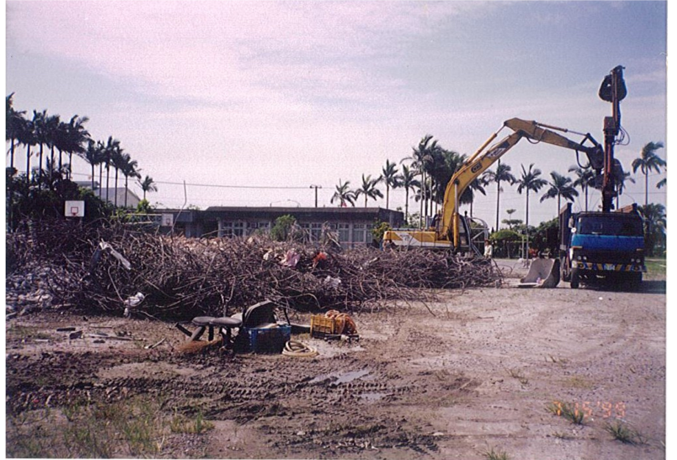
拆除舊教室後的空地，就做為日後的操場