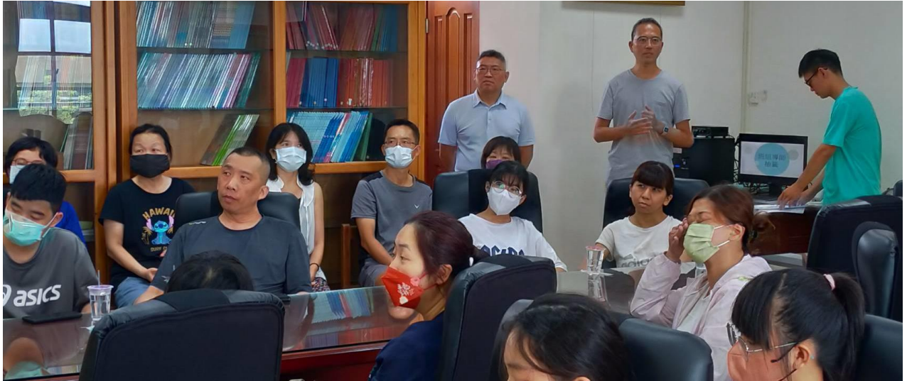
▲活動組長正在說明導師抽籤流程。