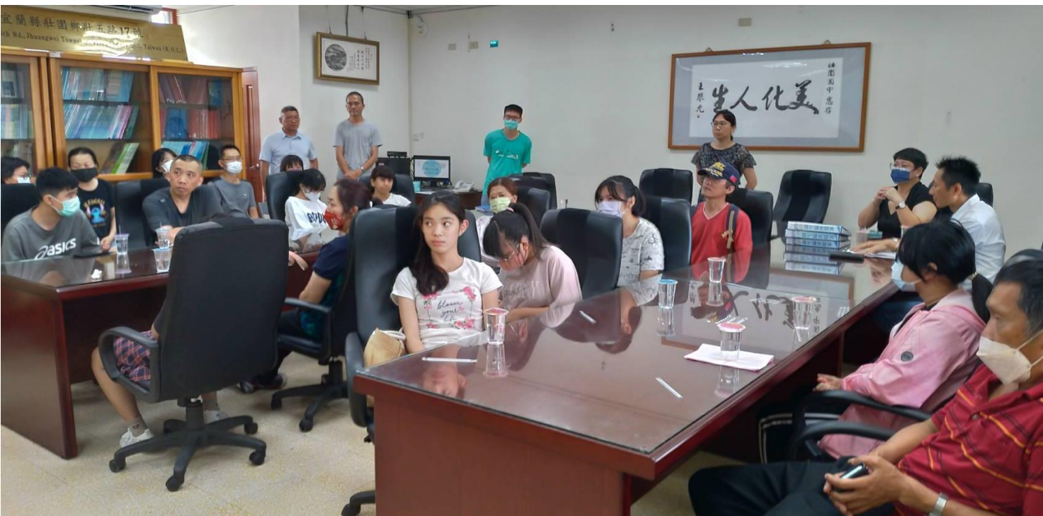
▲ 家長會吳常務委員、教育處代表、本校行政代表、教師會代表及家長出席公開編班作業。