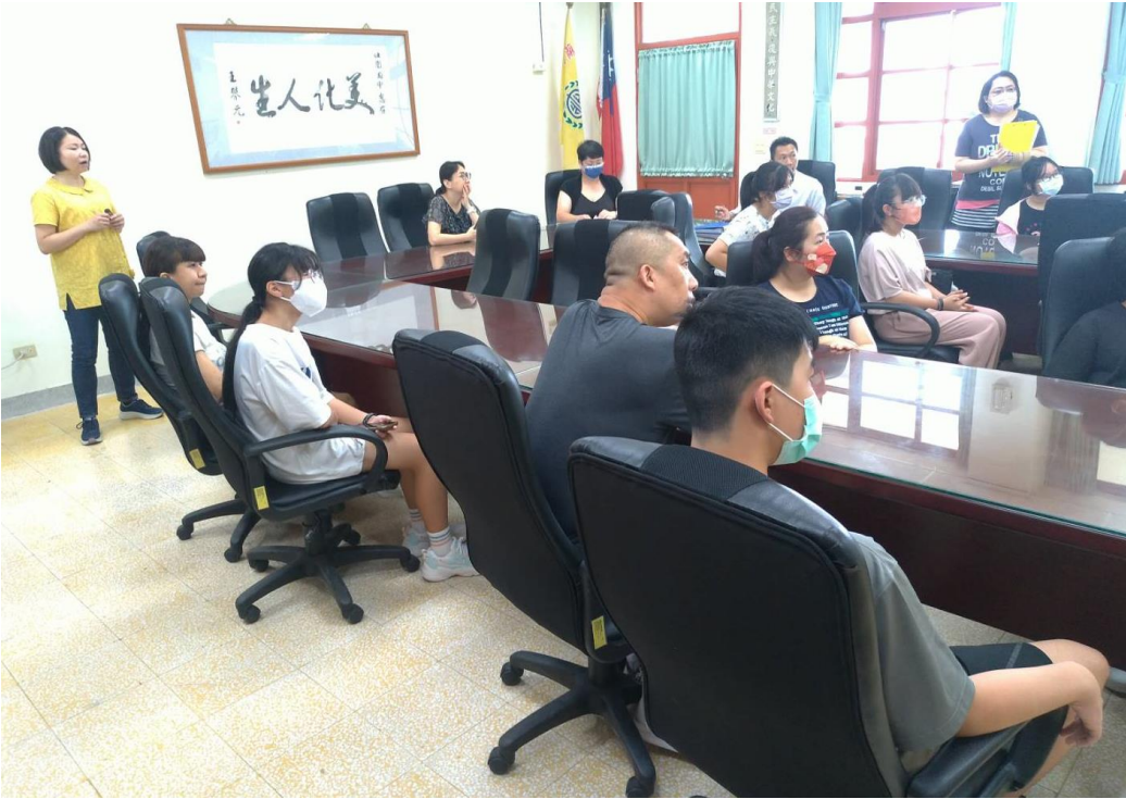
▲ 註冊組說明編班設定及編班步驟。