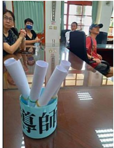
▲新生編班名單，大家的見證下，即將進行導師抽籤。