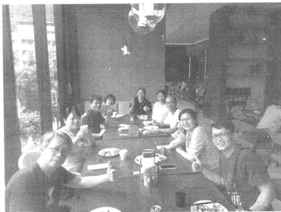
學年老師聚餐聯誼