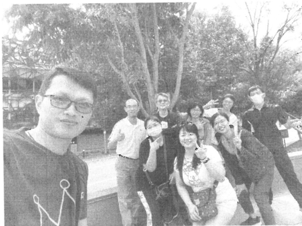
礁溪溫泉公園踏青