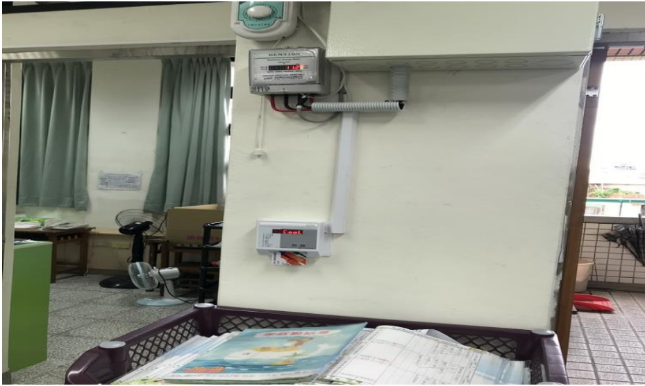
能源管理系統(需量看板、wed 需量主機及儲值機等)