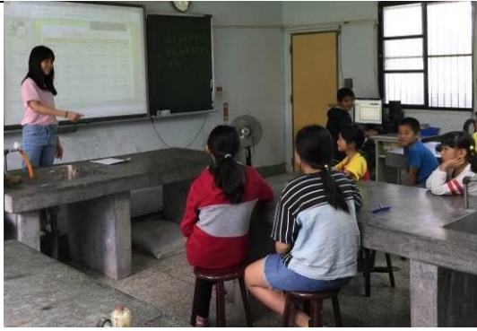
環保小局長主持生態會議