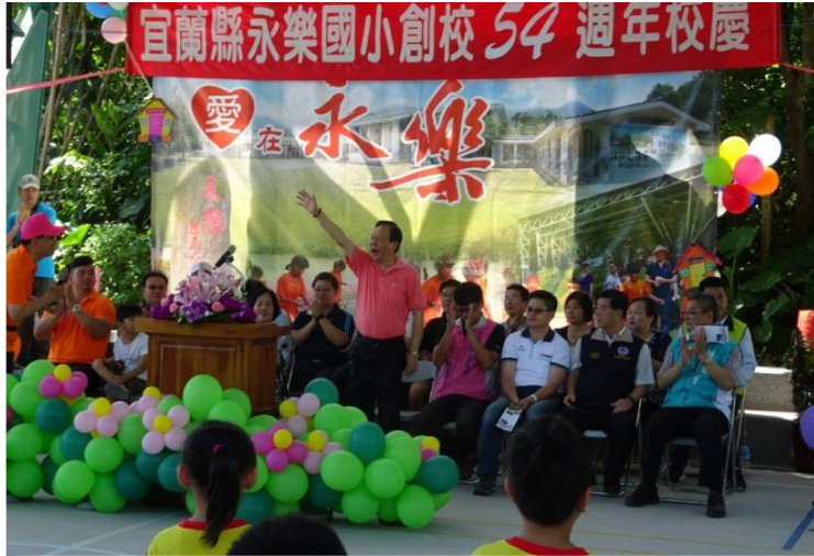
▲ 發佈者：譚杰 特派記者 2018年05月06日 14:49 在地新聞、林棋山、陳金麟