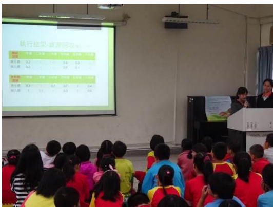
小局長生態會議報告