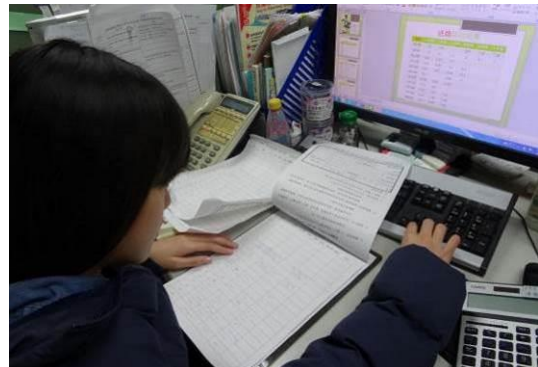
環保小局長就蒐集之資料彙整簡報