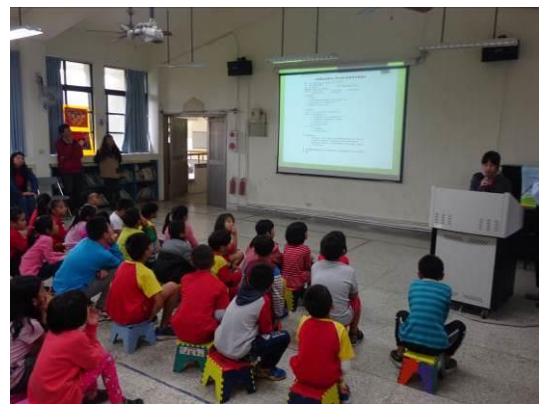
小局長生態會議報告