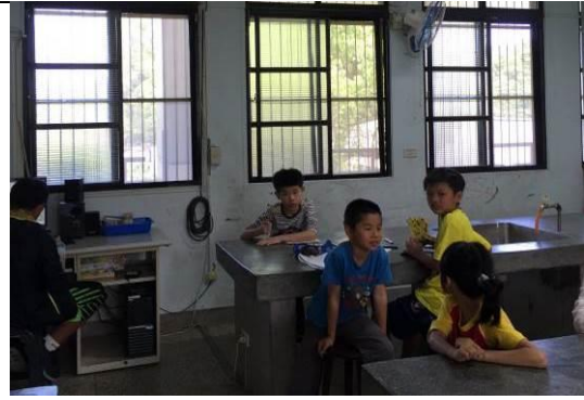
各班代表討論會議事項