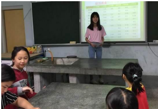
環保小局長主持生態會議