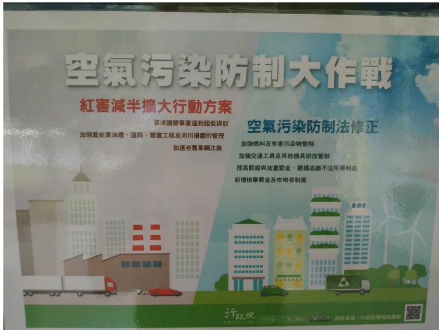
照片 5 說明：校園中布置有空氣品質宣導公告-空氣汙染防制大作戰。