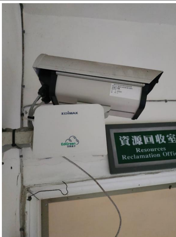
照片 2 說明:透過「宜蘭縣青天計畫」,提供學校場地裝設空氣盒子於校園中,隨時監控校園中的空氣品質。