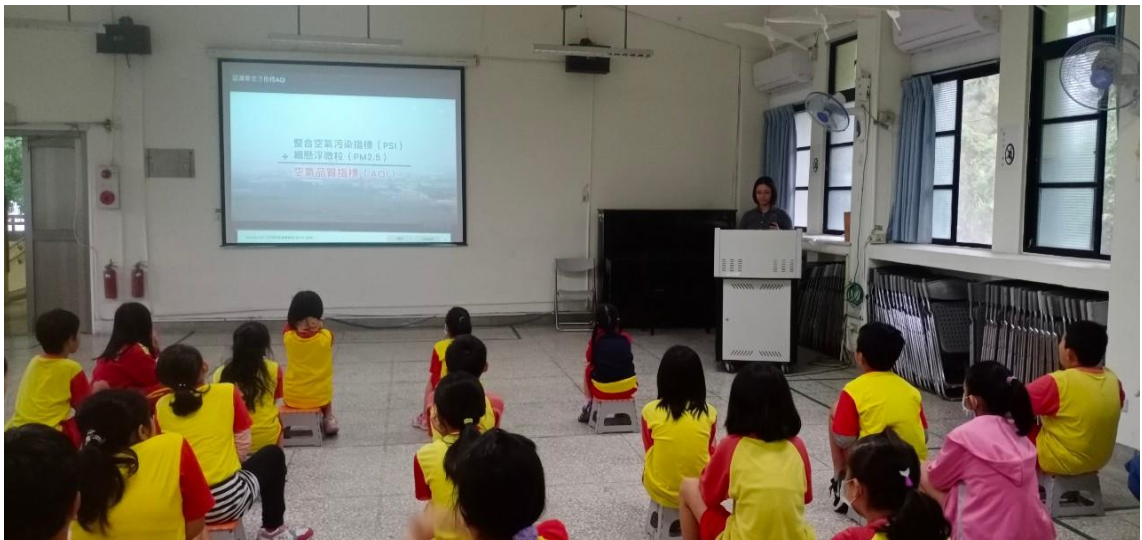
照片 10 說明：空氣品質教育宣導-介紹 AQI 空氣品質指標。