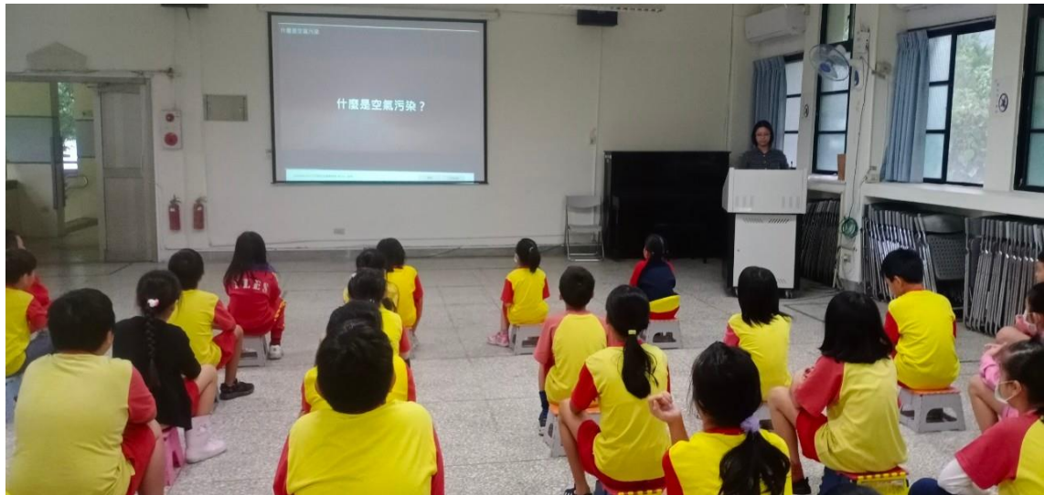
照片 8 說明：進行空氣品質教育宣導活動。