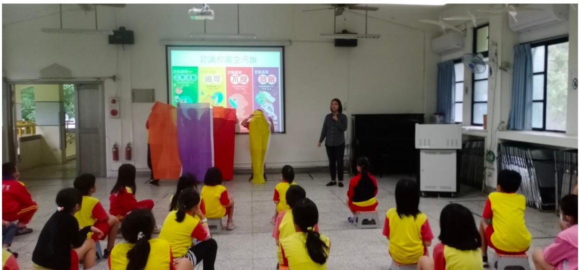
照片 11 說明：空氣品質教育宣導課程-說明空氣品質旗幟。