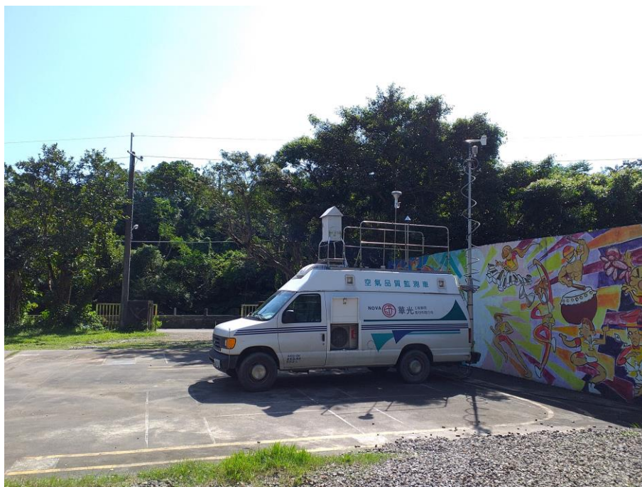
照片 4 說明：空氣品質監測車於不同的天氣環境狀況下監測本校及社區空氣品質。