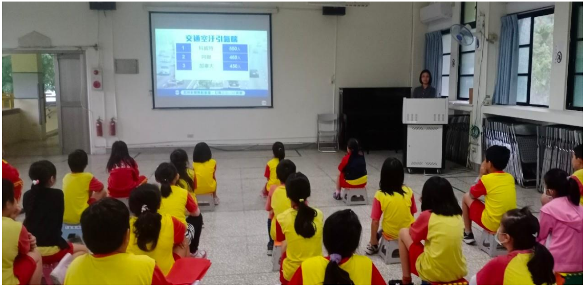
照片 9 說明：空氣品質教育宣導-說明空氣汙染會造成氣喘，造成身體傷害。