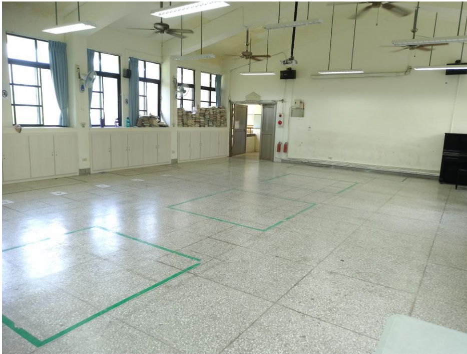
照片 14 說明：如室外空氣品質不良時，本校規劃於室內活動教室進行身體動態活動。