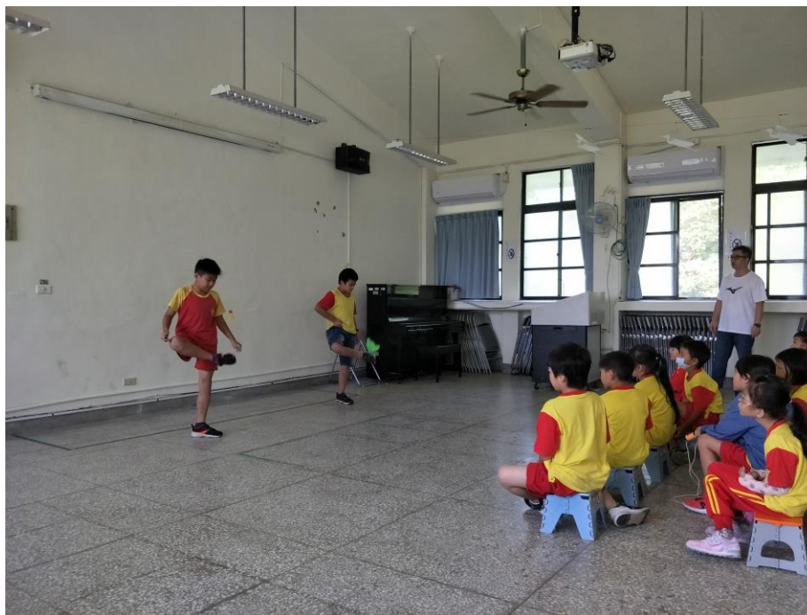
照片 13 說明：如室外空氣品質不良時，本校規劃於室內活動教室進行身體動態活動。