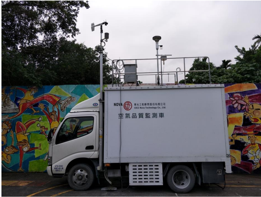
照片 3 說明：空氣品質監測車於不同的天氣環境狀況下監測本校及社區空氣品質。