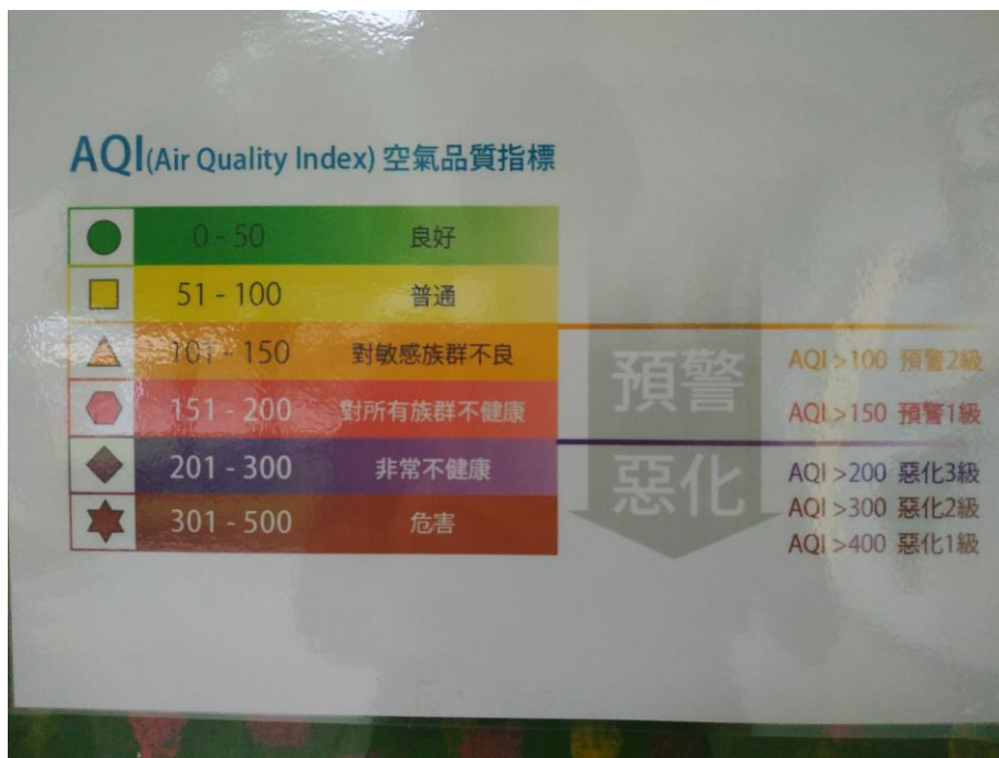
照片 6 說明：校園中布置有空氣品質宣導公告-介紹空氣品質指標。