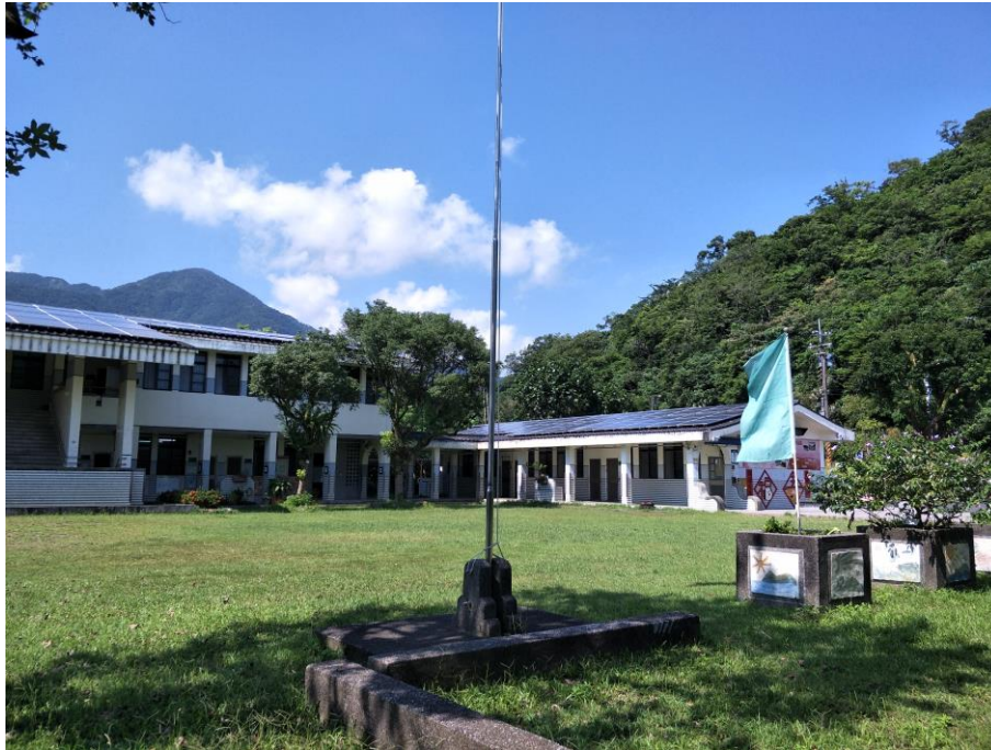
照片 12 說明：空氣品質教育宣導課程-在校園中放置供氣品質旗幟