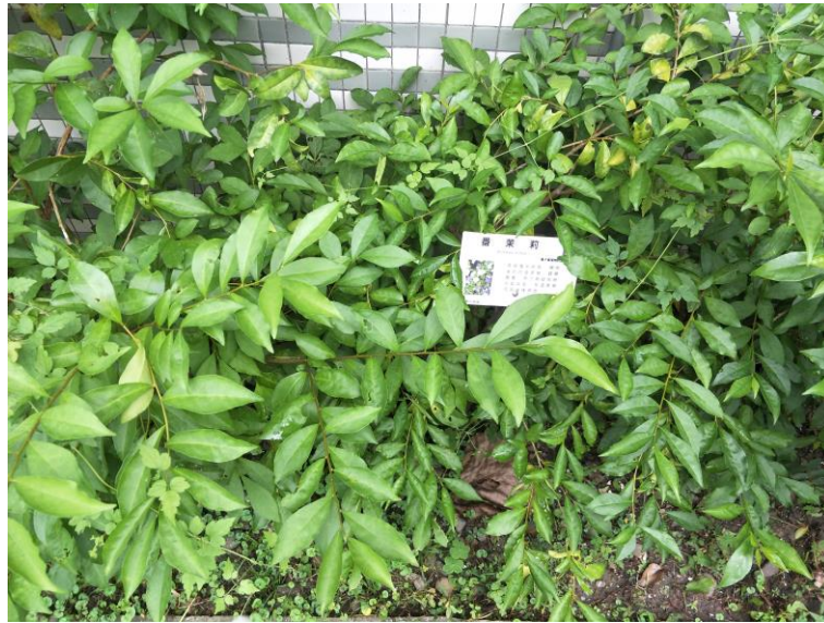
照片 3 說明:校園「蕃茉莉」解說-本校印製 QR-Code 校園植物牌，師生探尋校園植物可掃 QR-Code 認識校園植物。。