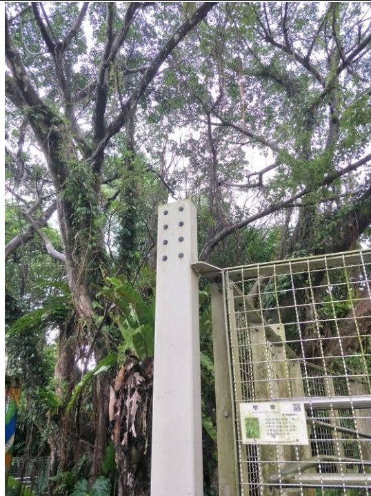
照片 2 說明：校園「榕樹」解說-本校印製 QR-Code 校園植物牌，師生探尋校園植物可掃 QR-Code 認識校園植物。