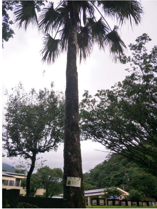
照片 1 說明：校園「蒲葵」解說-本校印製 QR-Code 校園植物牌，師生探尋校園植物可掃 QR-Code 認識校園植物。