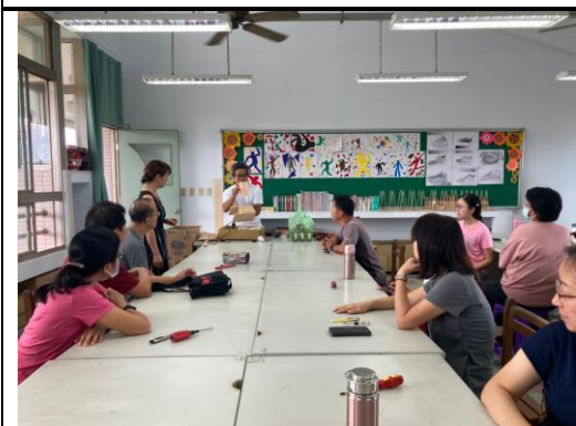
經由講師一一的介紹，讓看似困難的燈飾可以迎刃而解。