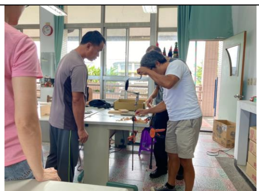
大家期待手工DIY木製燈飾的產出。