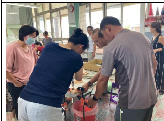
木材檯燈體驗實作