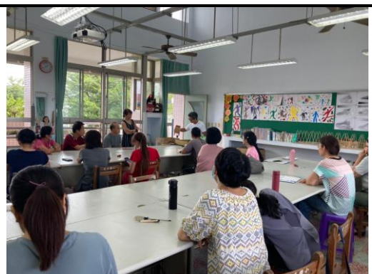
木製的燈飾加上少許的裝飾，顯得相當浪漫。