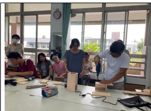
藝術家駐校藝術推廣研習