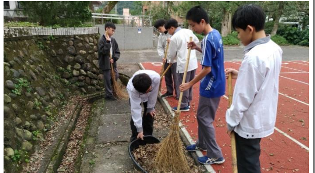
中午及下午打掃時間全校師生進行環境維護