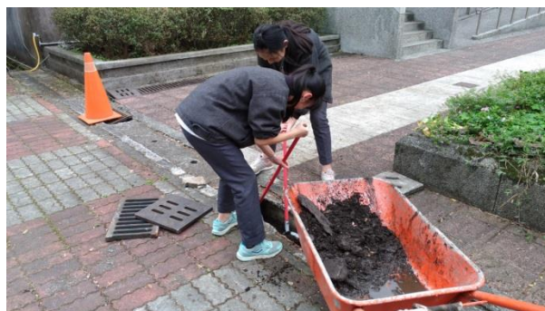
防治蚊蟲登革熱校園水溝定期清理