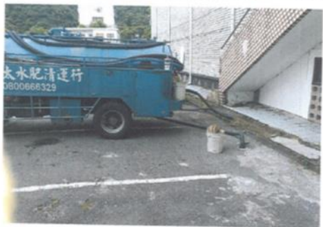
體育館、勤學樓化糞池清理相片