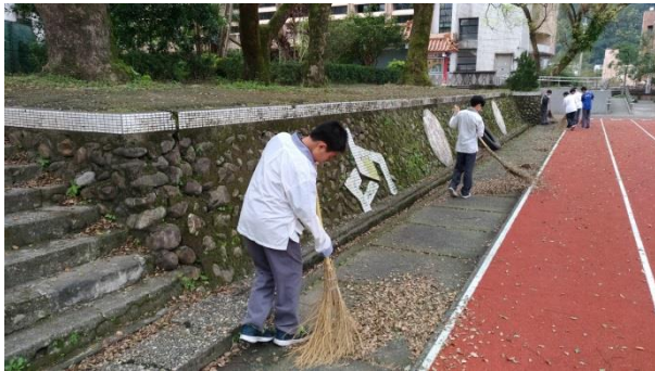
中午及下午打掃時間全校師生進行環境維護