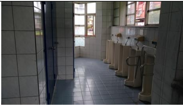
廁所之清潔及維護