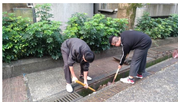
防治蚊蟲登革熱校園水溝定期清理