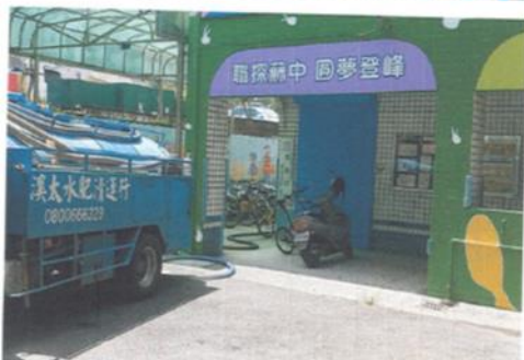
自強樓化糞池清理相片