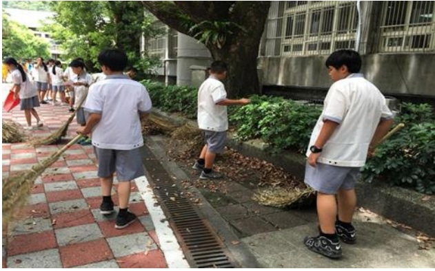
中午及下午打掃時間全校師生進行環境維護