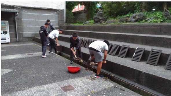
防治蚊蟲登革熱校園水溝定期清理