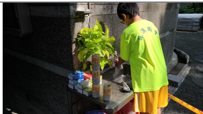
校園積水容器清理