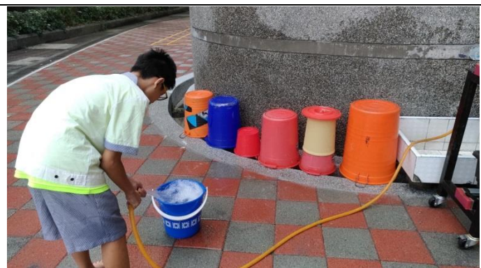
校園積水容器清理