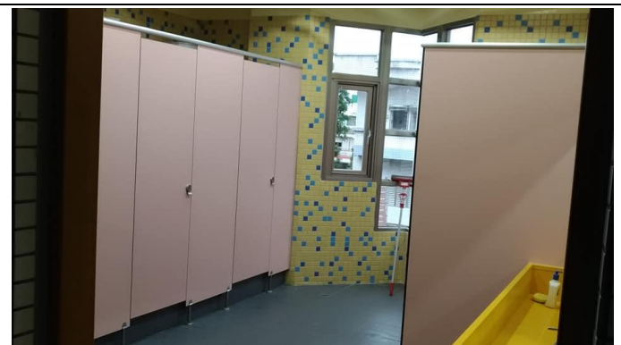
全新老舊廁所整建工程