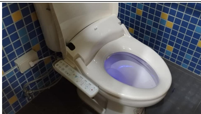
學生用廁所使用免治馬桶