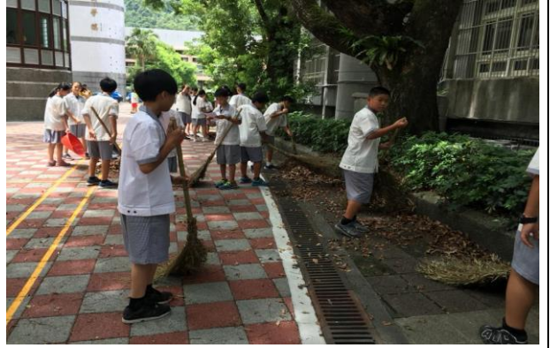
中午及下午打掃時間全校師生進行環境維護