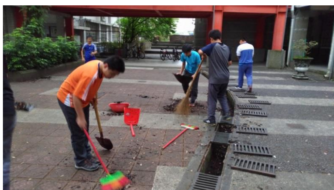
防治蚊蟲登革熱校園水溝定期清理