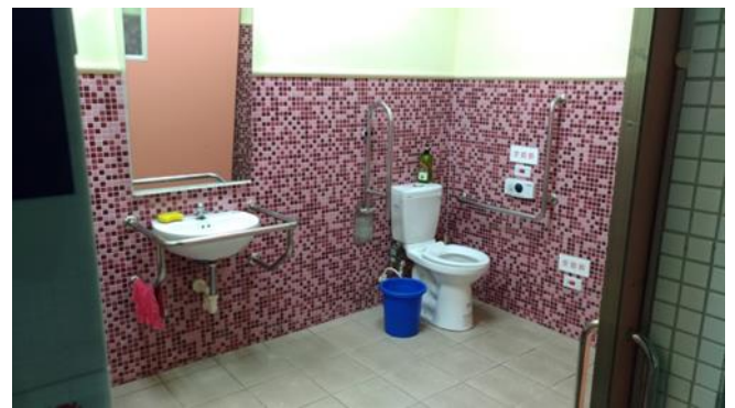
廁所之清潔及維護