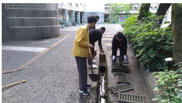
防治蚊蟲登革熱校園水溝定期清理