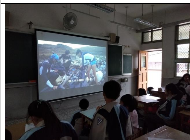
學生觀看減塑議題看志工淨灘分類