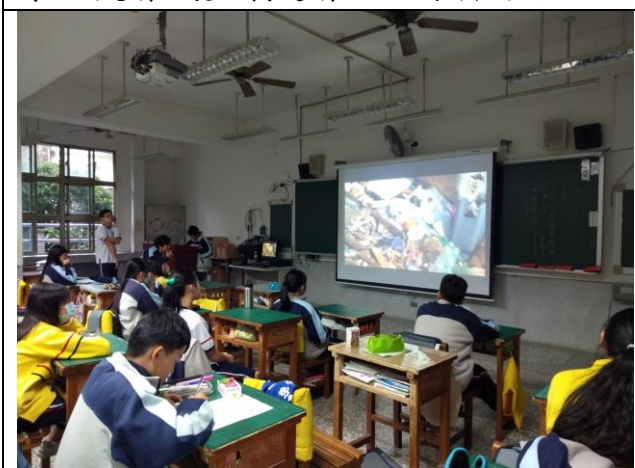
學生觀看減塑議題了解塑膠成為微塑膠的環境傷害