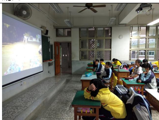
學生認真觀看減塑議題