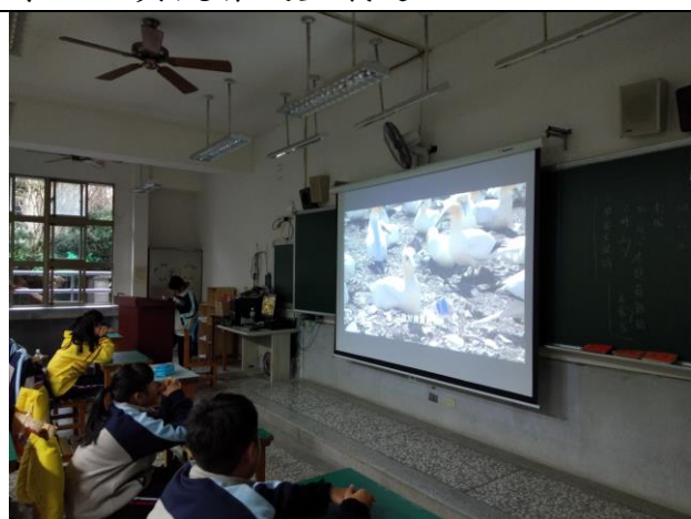
學生觀看減塑議題了解鳥類誤食塑膠的傷害