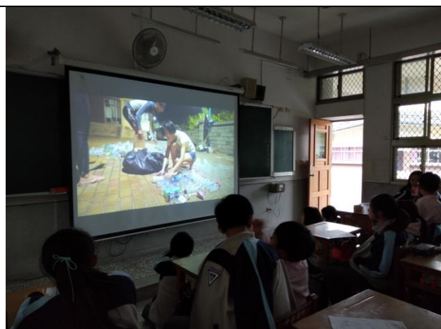
學生觀看減塑議題了解塑膠廢棄物數量龐大