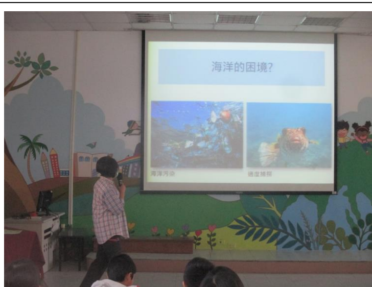
講解海洋面臨的困境

以下請附上：1. 活動照片至少四張(像素 400*300)，並略做說明。 2. 活動學習單 (若有)。 3. 腳本或數據 (若有)。