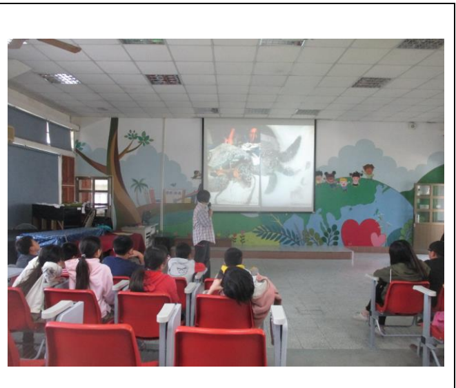
海龜被海洋廢棄物纏繞