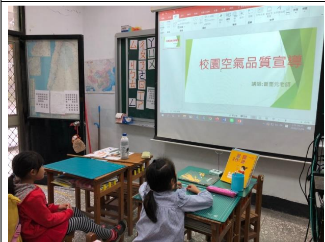
109-3-2-3 學校宣導活動 3