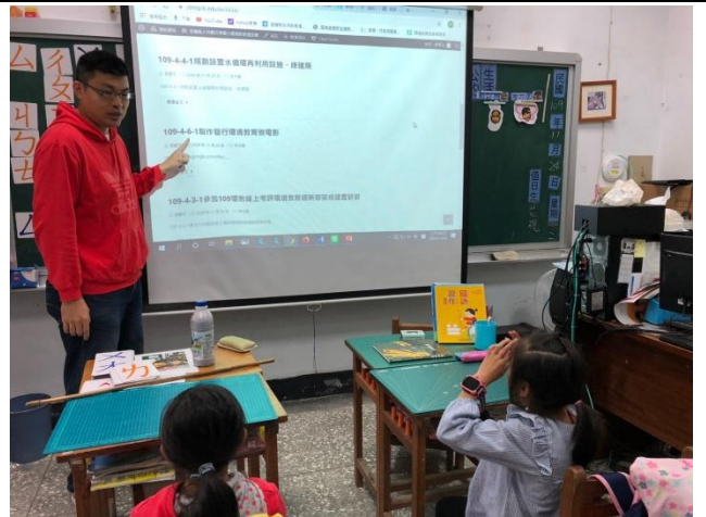
109-3-2-3 學校宣導活動 2