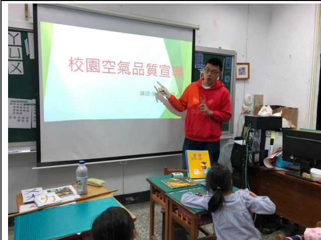
109-3-2-3 學校宣導活動 1