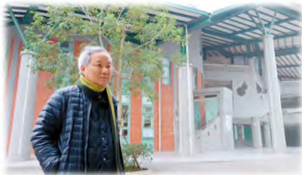
建築阿公在一手打造的凱中校園中

位於縣政特區的凱中，獨具風格的建築物及校園景觀，常常吸引旅客的走訪與探問：「這獨特的建築、優美的環境，是民宿嗎？」而當他們得知這是一所公立國中時，更總是驚嘆地說，能夠在這放眼綠地、景色開闊的校園中就讀，真是太令人羨慕了！凱旋國中－「台灣第一所無校門、無圍牆的校園」－我們美麗的校園，是由今年畢業生典範人物－黃建興建築師所設計、打造而成。