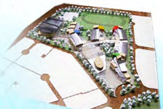
凱旋國中－是黃建築師順應地形設計的巧思，校地輪廓神似一枚菩提葉

從校園建築規劃、都市生活環境、深耕教育文化與空間結合、與在地文化連結的品味推廣，建築師獲獎無數，更能看見他橫跨建築、教育、藝術、營建工程的影響力。黃建興建築師由一位宜蘭魚販之子，在台灣土生土長，靠著努力向學，以知識翻身成為台灣校園建築之父，正是值得每位凱旋之子學習的典範，他就是我們的建築阿公－黃建興。