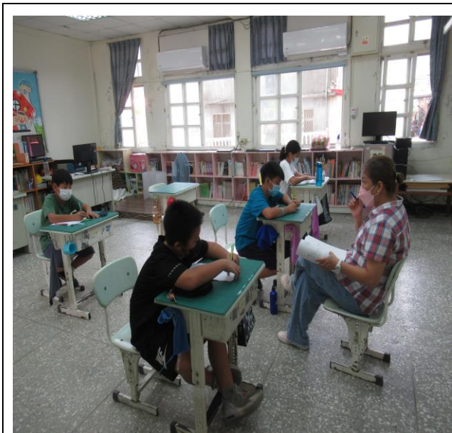
評量活動 5-紙筆評量