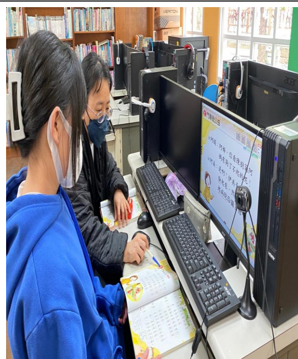
評量活動 8-口頭評量