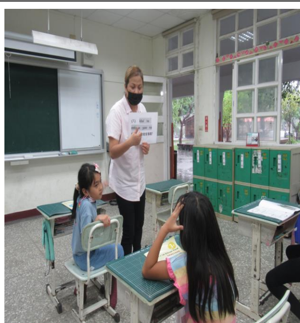
評量活動 2-發音評量