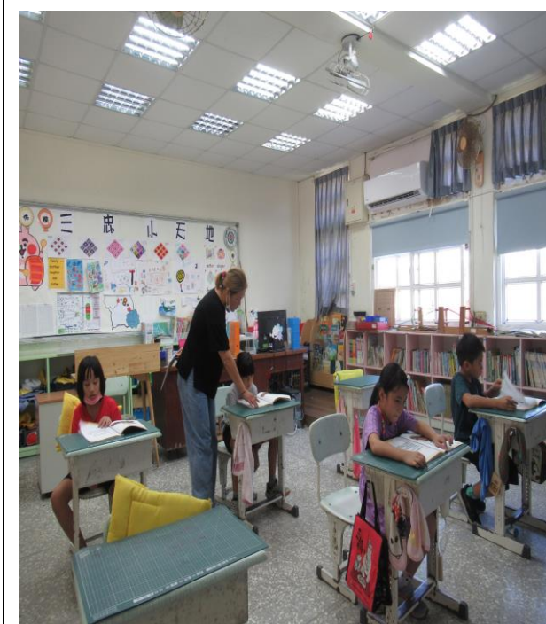
評量活動 3-個別評量(教材)