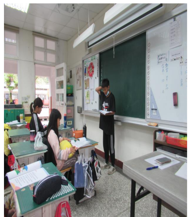
評量活動 4-個別評量(朗讀)