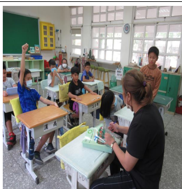
評量活動 6-發表評量