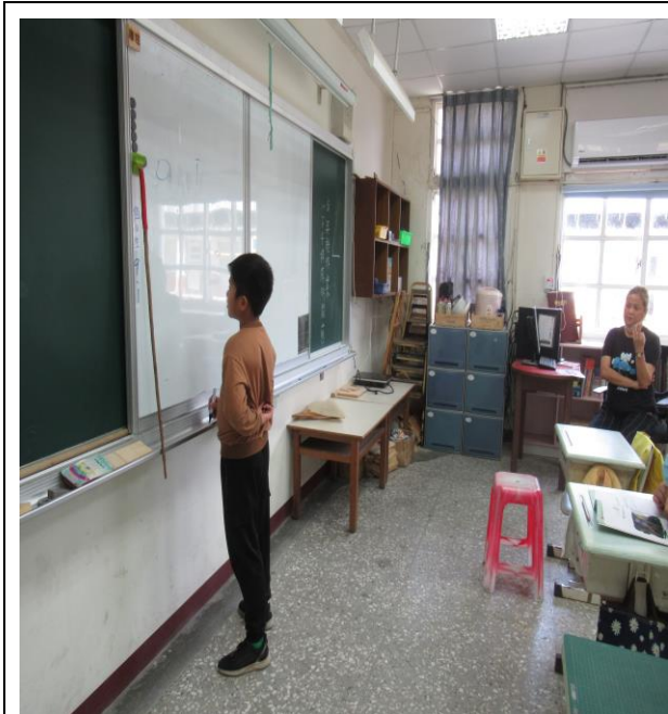
評量活動 1-聽寫測驗