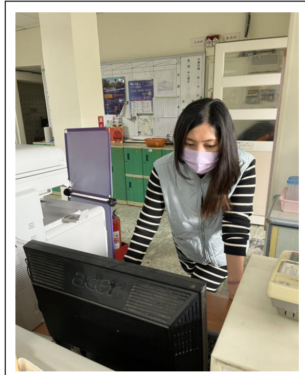
配合母語日播放母語歌曲(教導主任)