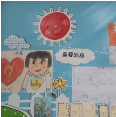
公佈欄：重要消息、學生作品