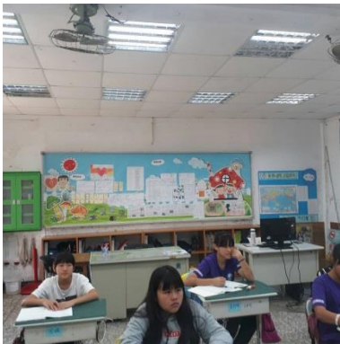
學生座位排列整齊不影響後排者