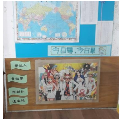
學生共同完成 1000 片拼圖