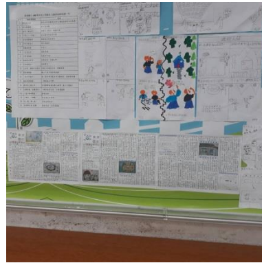
公佈欄：學生作品、校刊