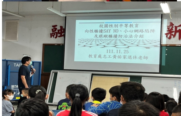
性別平等教育宣導