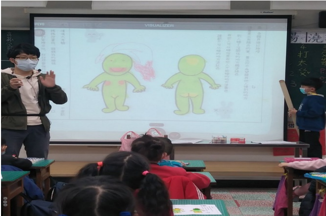
性騷擾防治教育入班宣導-身體紅綠燈活動