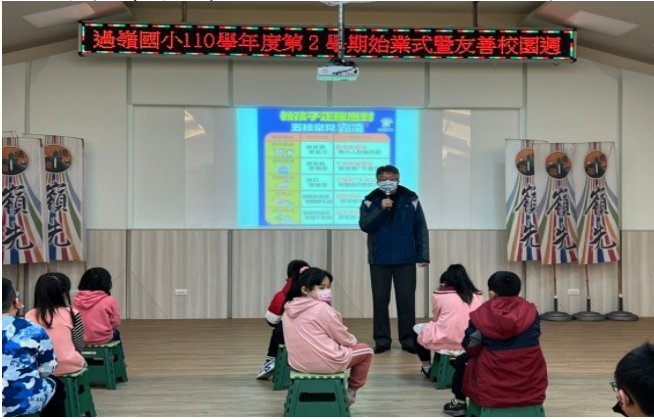
性別平等教育-兒少權益與法定通報專題講演