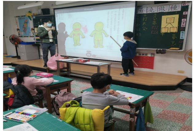
學生分享身體不同區域被不同人觸摸後的感受