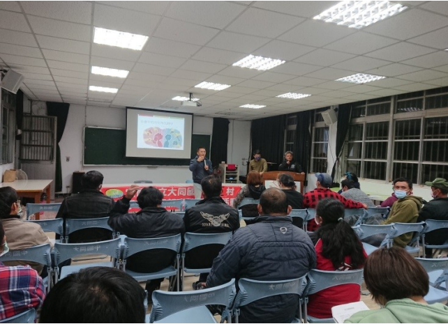
性別平等教育研習: