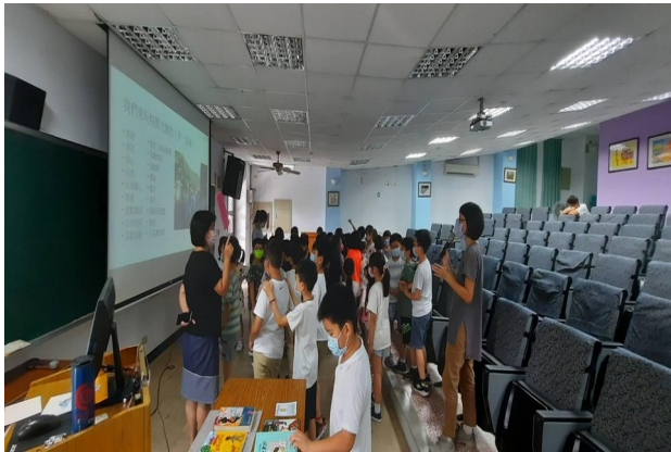
性別特質大風吹遊戲