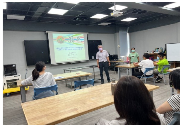
性別平等教育暨婦幼安全專題