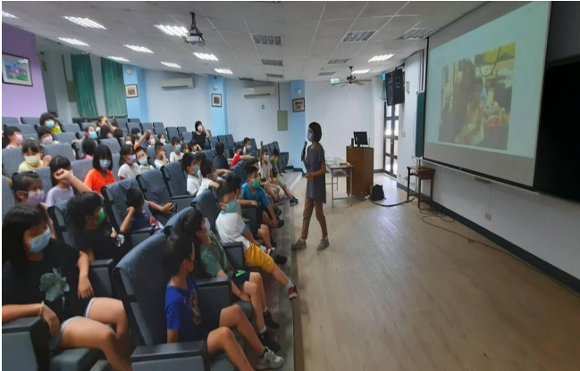
性平教育講座-性別歧視對人的影響