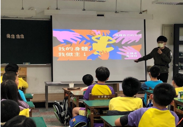
輔師說明性騷擾、性侵害的種類