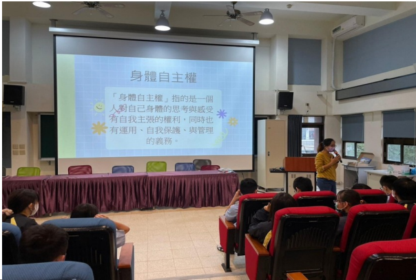
性平教育宣導-介紹身體自主權: