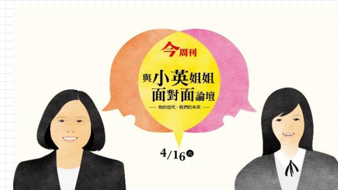
2016 妳的世代 我們的未來