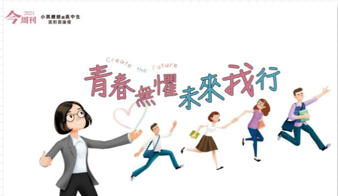
2021 青春無懼 未來我行

以不同趨勢議題、不同互動方式呈現，是全國高中生年度盛事！能夠充分表現自己的最佳論壇！