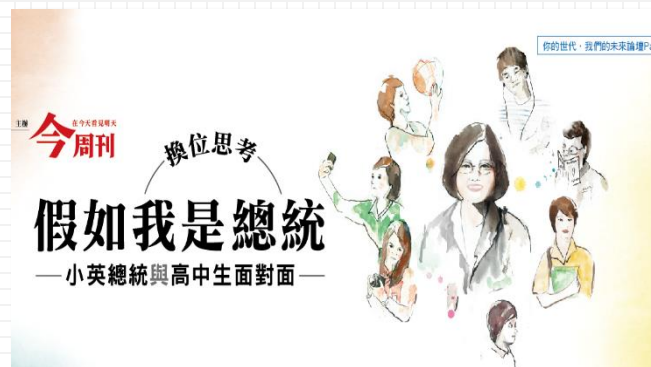
2017 換為思考 假如我是總統