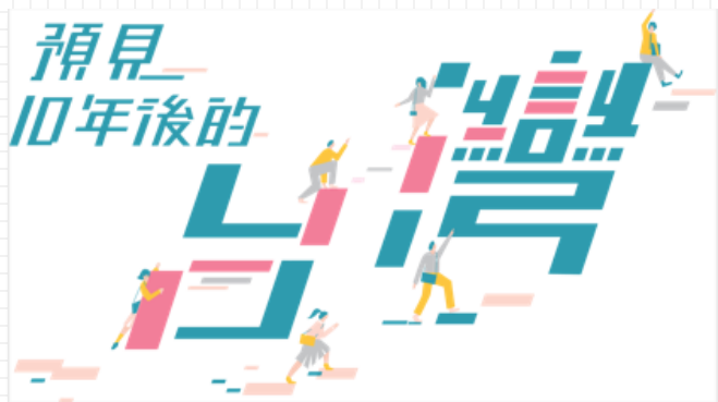
2018 遇見十年後的自己