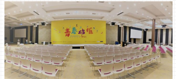
華南銀行總行2樓空景照

除原有簡報、QA 提問外，並增加論壇互動度的活動設計，邀請台東海端鄉布農高中生開場表演「八部合音」、現場手拿板標語由學生提出、形象牆影片拍攝與公民素養學堂。