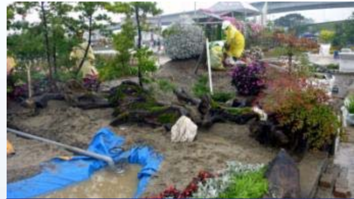
國立臺中高農-森林科 花博全國造園景觀競賽得獎作品 施作中(高職大專組第二名)