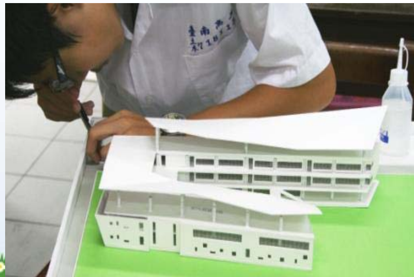
國立臺南高工-專題製作模型製作