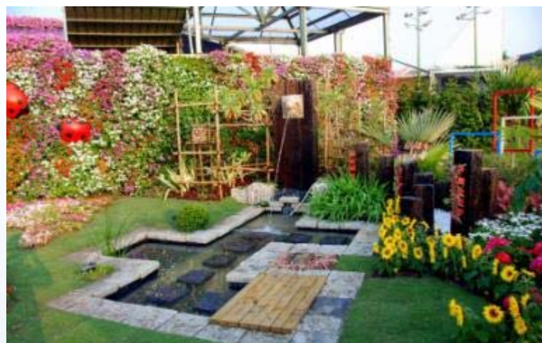
國立臺中高農-園藝科 花博全國造園景觀競賽得獎作品