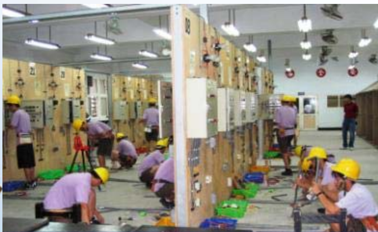
國立澎湖海事-配線實習