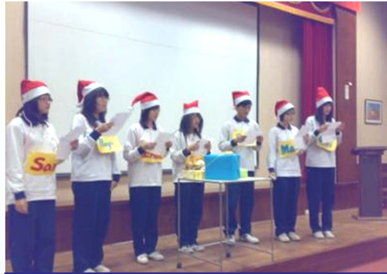
國立花蓮高商-英語讀者劇場