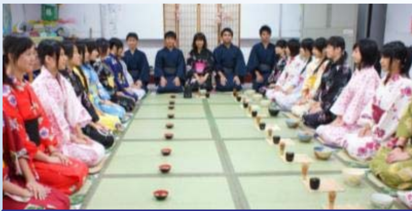
協和工商-日文科茶道課程