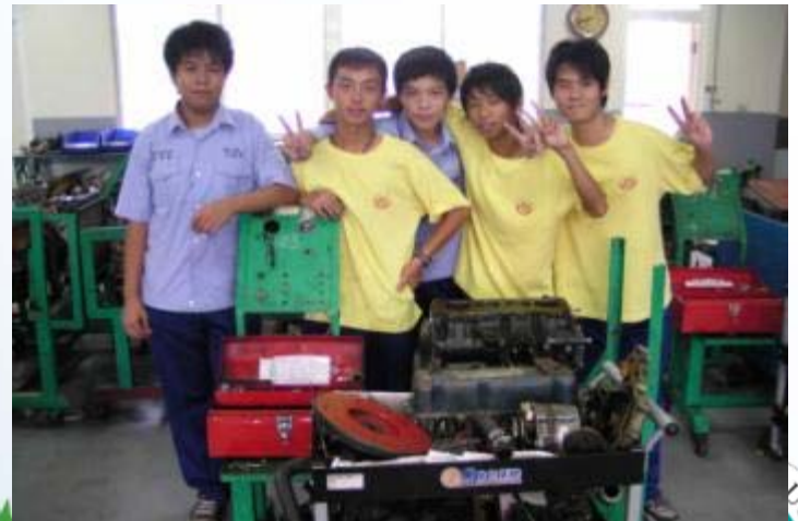
國立旗山農工-汽車科-引擎分解