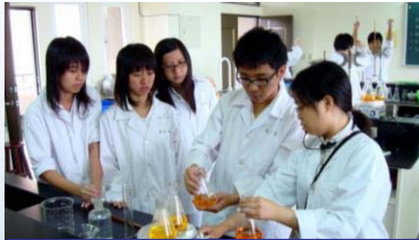
國立臺中高農-食品加工科 食品化學實驗

培養食品科技相關專業及技術知能，能進行食品科技各項基本技術操作，並取得食品相關證照。