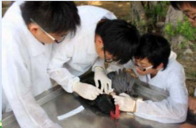
國立臺中高農-畜產保健科 保健衛生實習

訓練同學具備農業生產、行銷及永續利用的基本知能，並具有農業相關專業領域的技能與知識。