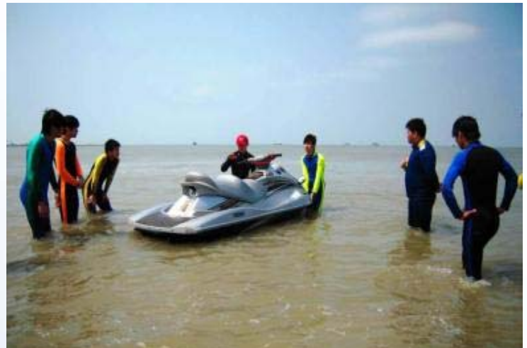
金門農工-水上摩托車教學