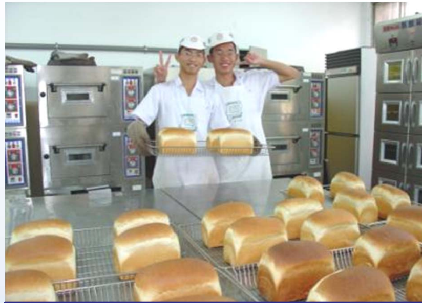
國立臺中高農-食品加工科 食品加工之麵包烘焙實習