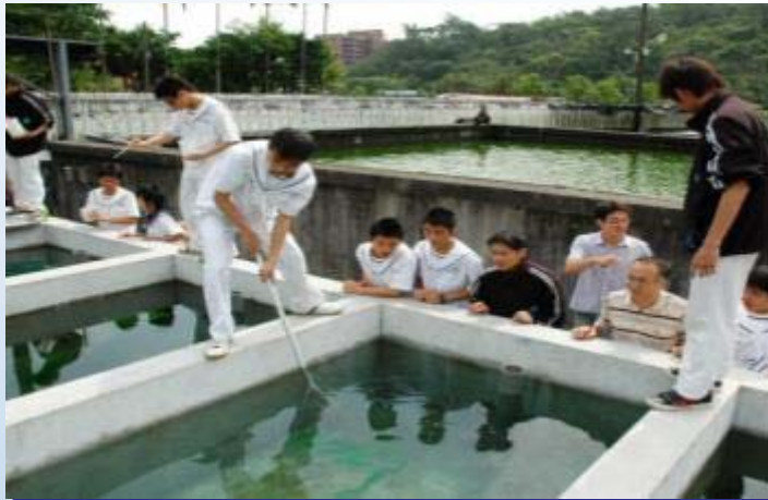
蘇澳海事-人工養殖實習