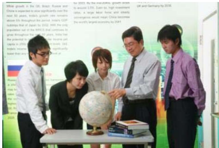
樹德科大-國際企業與貿易系