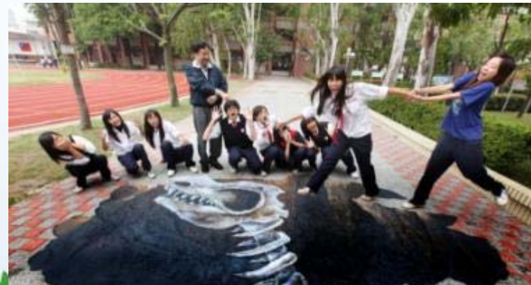
國立臺南高商-廣告設計科 繪畫結合地景錯視