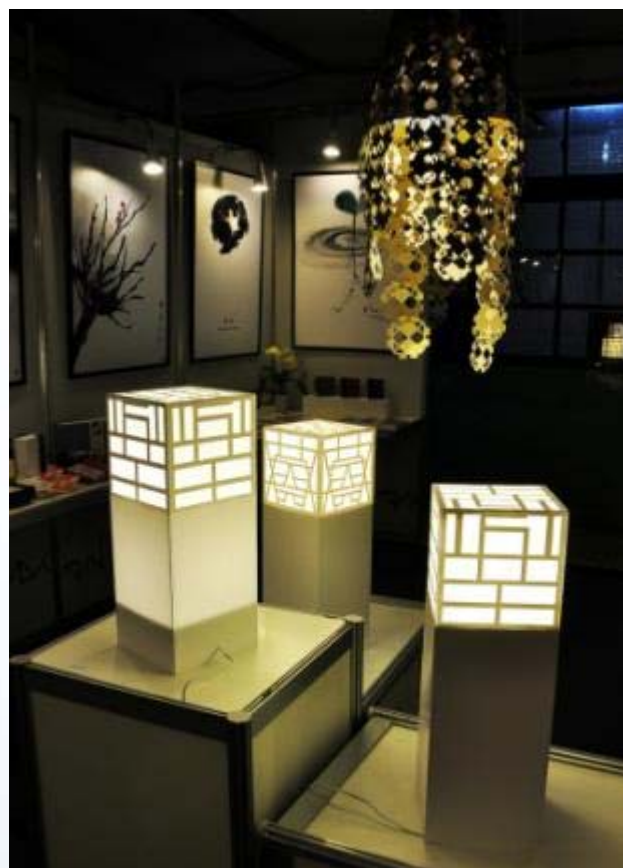
復興商工-廣告設計科 教育部專題製作競賽第一名