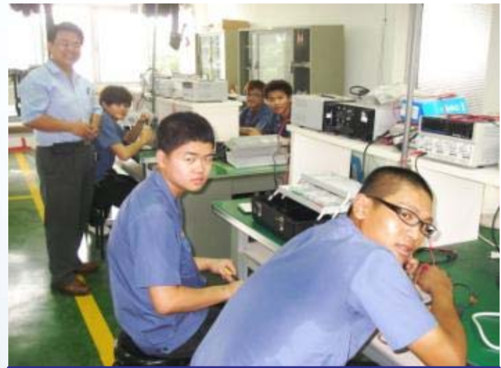
國立嘉義高工 汽車科-電子線路練習