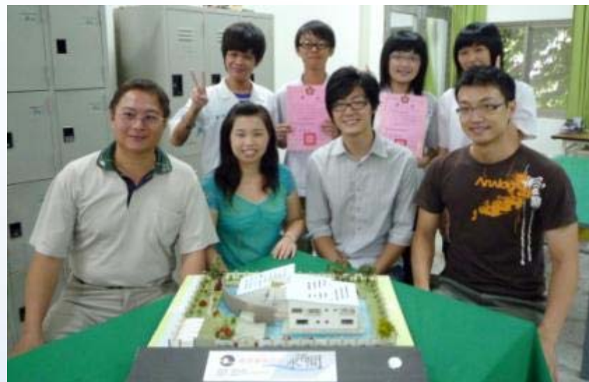
國立臺南高工-建築科 99年專題競賽第一名-水陌間