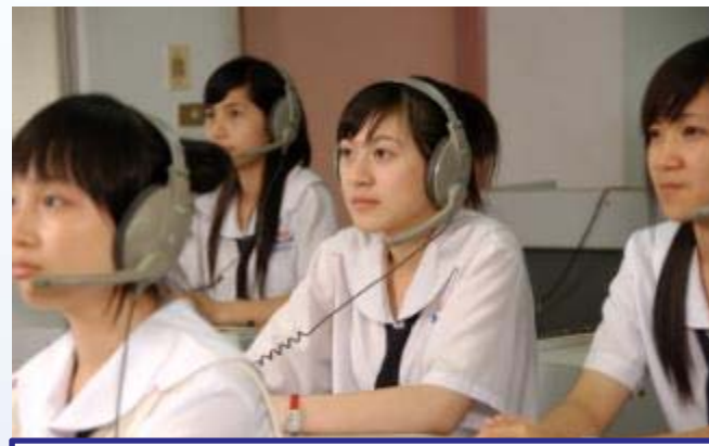
稻江護家-聽力課程