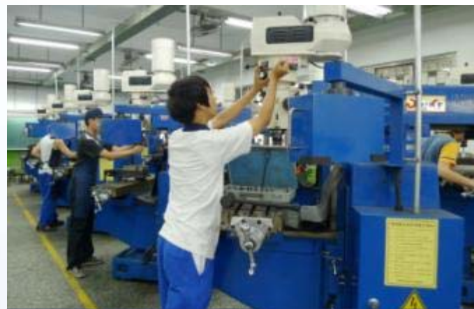
機械科-立式銑床實習