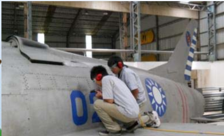
國立臺南高工-飛機修護科-實機鉚接