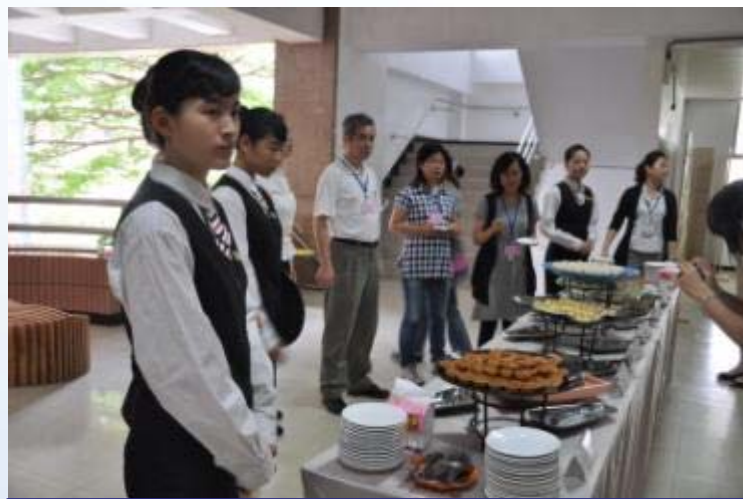
中山工商-學生實作

培養餐旅業初階服務與技術能力，如休閒觀光產業業務、旅館客務、餐飲內外場、餐旅服務等專業人才。