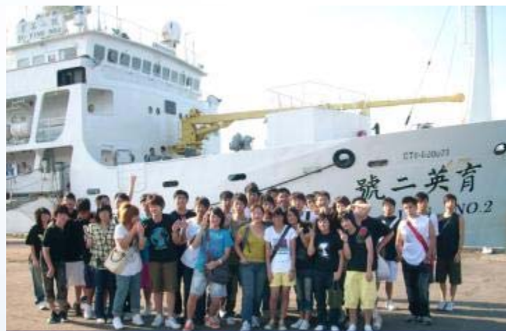
國立基隆海事-沖繩新港