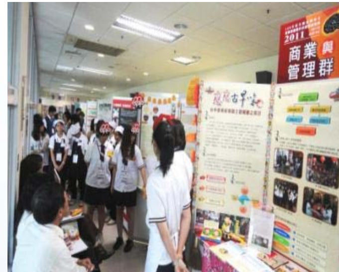
100年度全國高職學生實務專題製作決賽暨成果展

培養商業服務、商業計算、 現代經營技能、資訊科技 應用、銷售服務、管理會計、 人力資源管理、財稅金融之人才