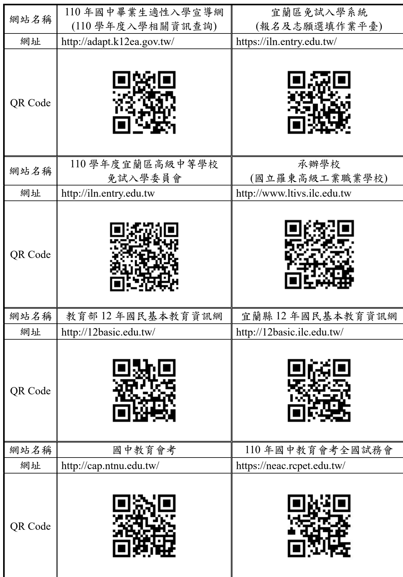
110 學年度宜蘭區高級中等學校免試入學參考網站一覽表