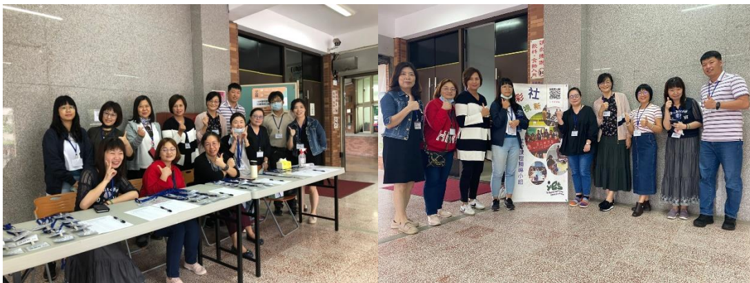
▲ 團結用心的宜蘭社會領域團隊