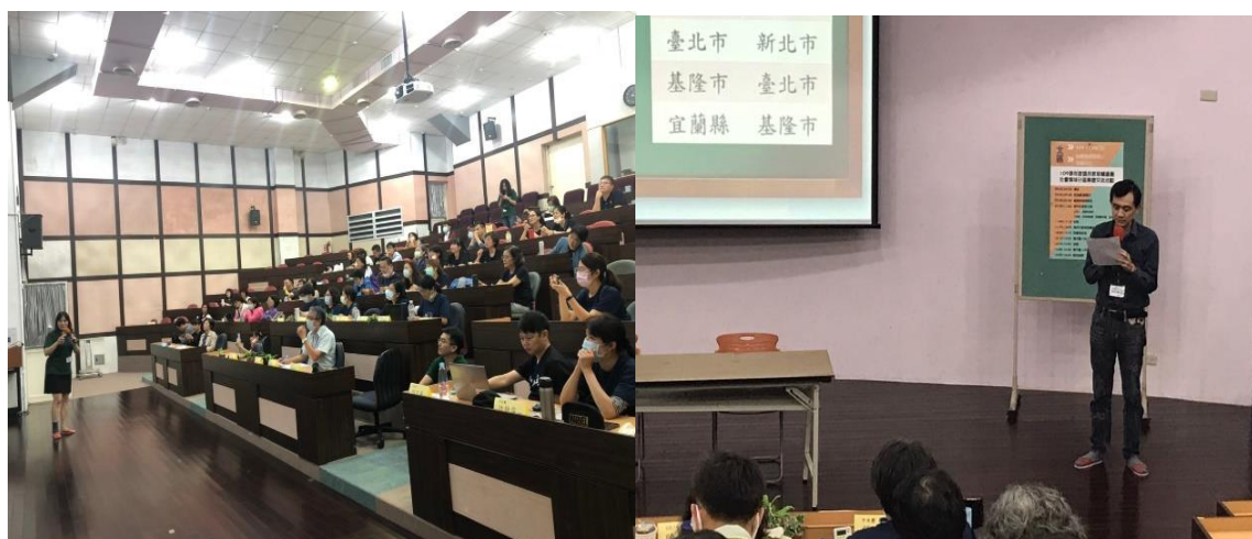
▲縣市團 108 學年度成果報告回饋