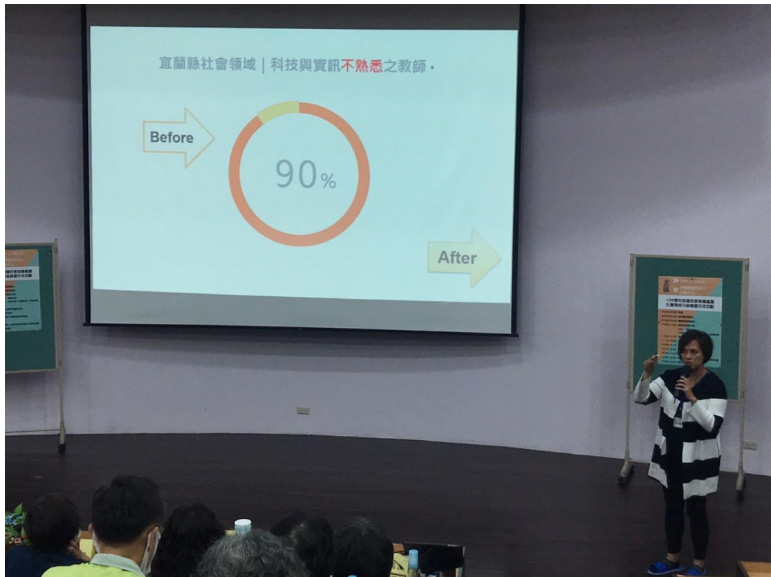
▲縣市團108學年度成果報告交流與討論