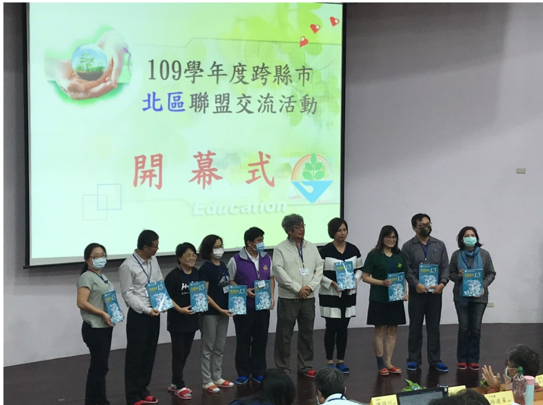
▲頒發社會領域輔導手冊「非常好社13」

而學習人文社會，就是希望讓學生心中有「牽掛」，社會因為有大家的相互關懷，才有「溫暖」，也因為人人「置身事內」才有進步與改善的可能。