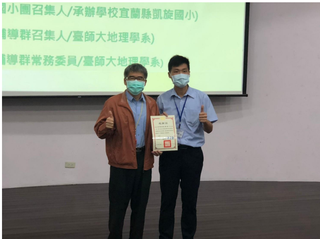
▲感謝凱旋國小提供舒適的場地