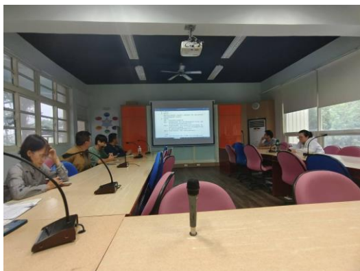
大南澳學校因應特殊情形午餐會議

另外，討論 10/23 因廚房鍋爐設備無法正常運轉，緊急以瓦斯鍋爐應急供餐當日未提供之湯品。廠商可另外加兩個雞塊，隔天或最晚下週三加菜。如有需改進的菜色，可傳 line 群組。